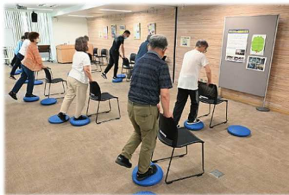
令和5年度協働事業 「ドライバーサポートフィットネス」