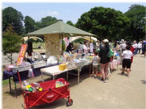
令和5年度協働事業 「公園にハートいっぱいの種を蒔こう」

提出先・問合せ 〒310-8610 水戸市中央1丁目4番1号 水戸市 市民協働部 市民生活課 協働係 電話 029-232-9151(直通) Eメール kyodo@city.mito.lg.jp