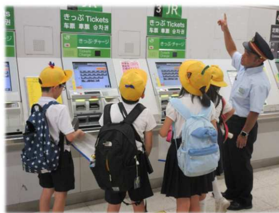
令和5年度協働事業 「子どもの新たな体験活動の創出と地域の再発見」