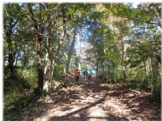
令和5年度協働事業 「キッズトレイルランニング大会」