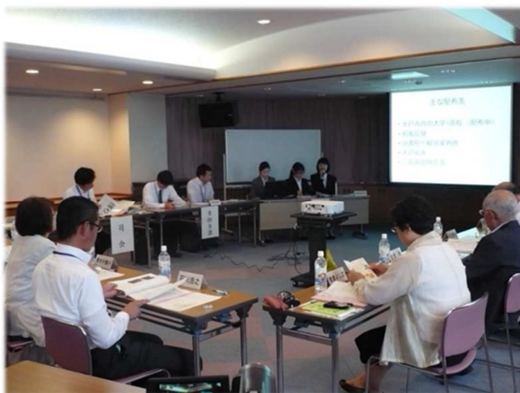
事業報告会の様子

公開の事業報告会を行います。 協働推進委員会は、この報告をもとに、当該事業を総合的に評価し、改善点や今後の方向性などを検討します。