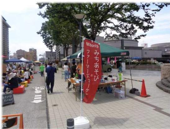
令和5年度協働事業 「市民参画による道路等パブリック空間の有効活用検討事業」