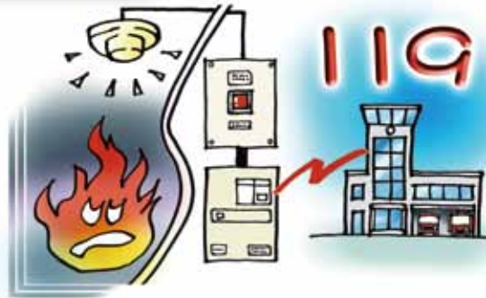
自動火災報知設備の作動と 連動した火災通報装置