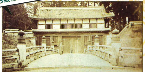
水戸城大手門 古写真