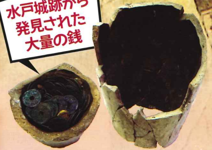
埋納銭(水戸市埋蔵文化財センター所蔵)