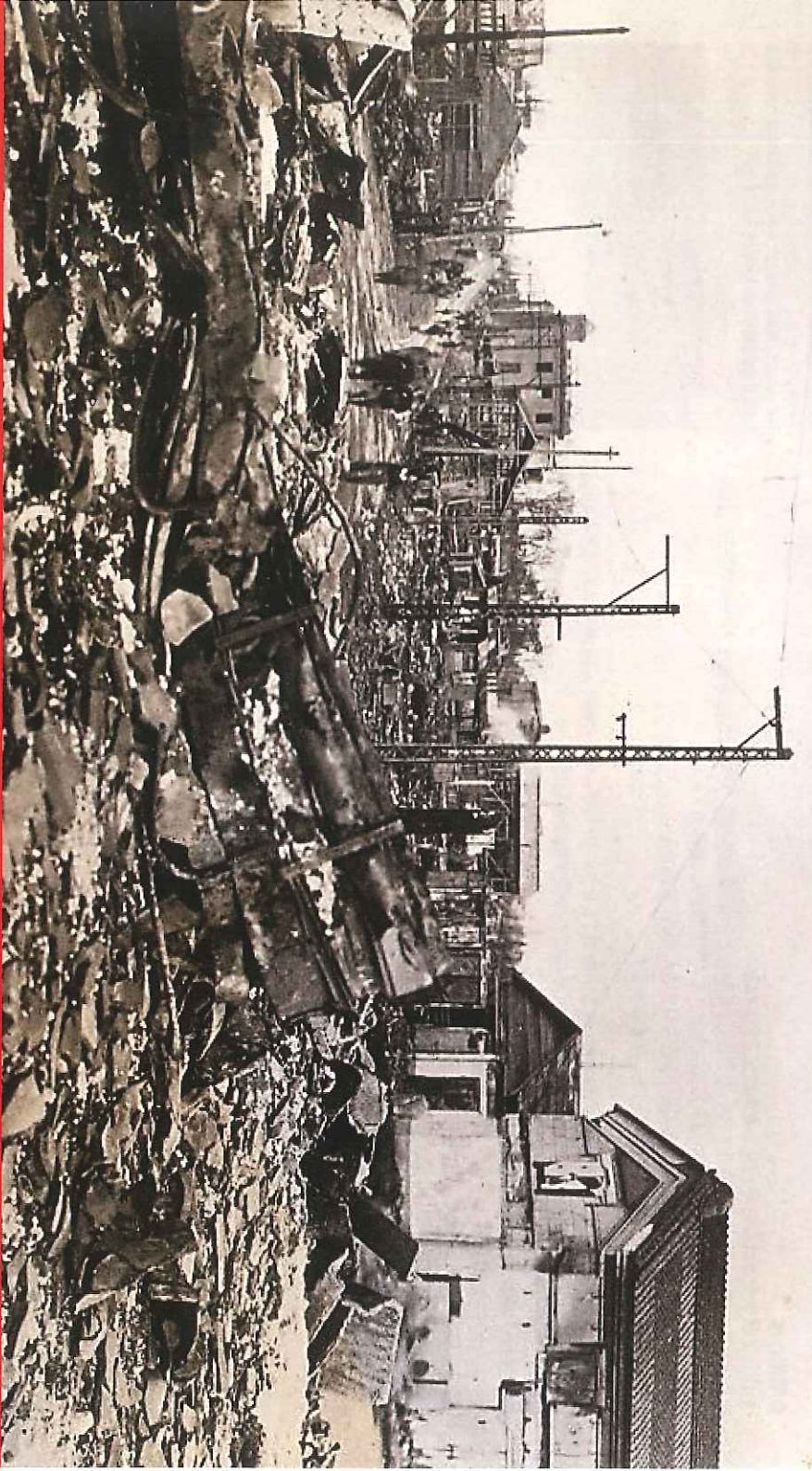
水戸駅前炎上図 [上] / 水戸空襲後の水戸市南町方面 [下]