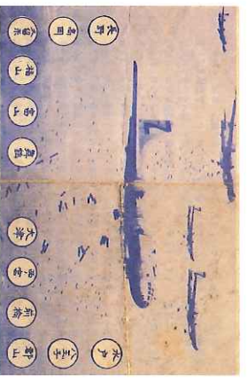
空襲予告ポスター

とてもきれいなチヨウチヨたちが、博物館に大集合します。会場でのワークショップや、自然観察会、クラフト制作など楽しい遊びもいっぱいです!