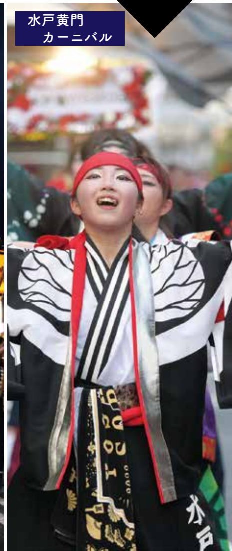
水戸黄門カーニバル

水戸の伝統工芸品である水府提灯を使った幻想的な行列。今年は、美しい舞いで“魅せる”隊列と、みんなで参加して“楽しむ”隊列の二手に分かれて練り歩きます。