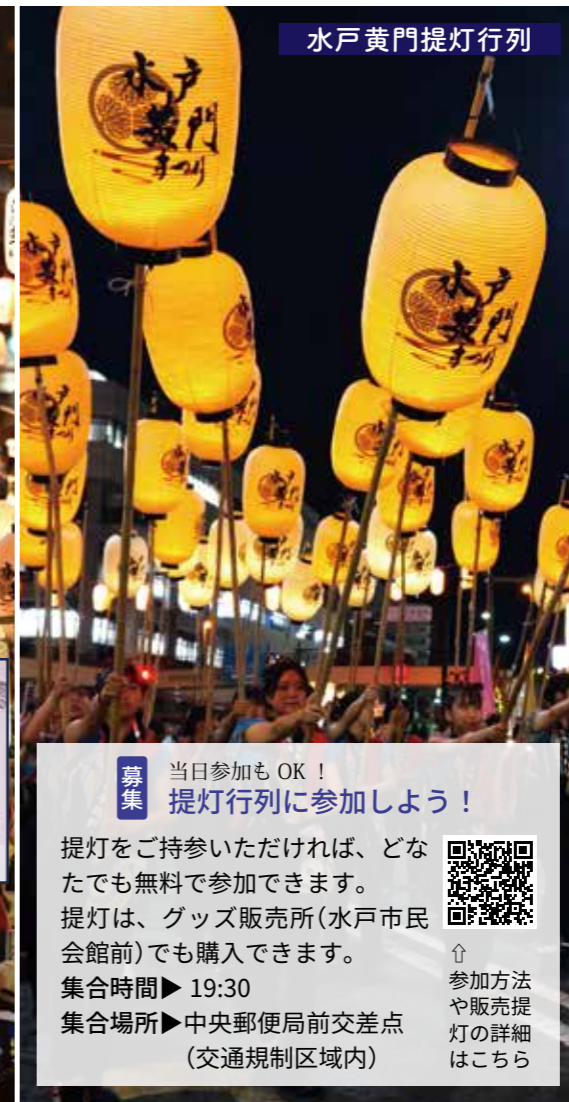
水戸黄門提灯行列