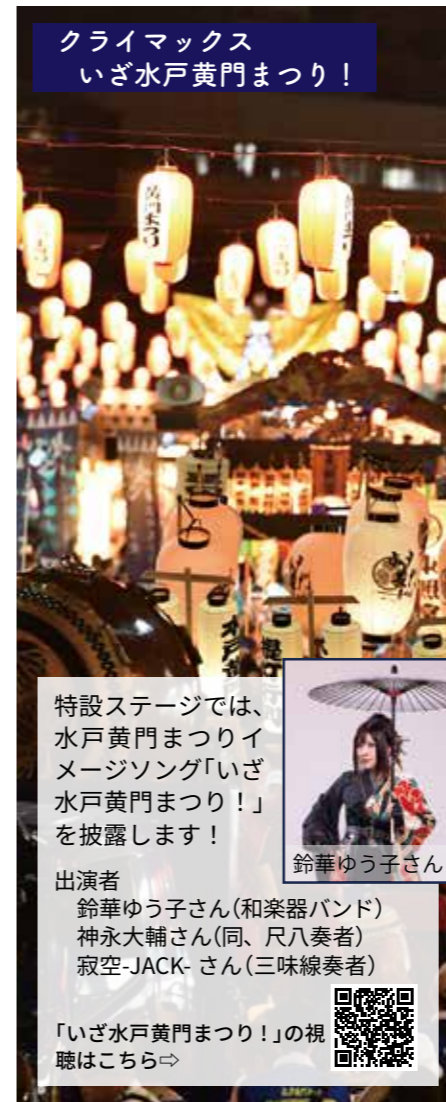
クライマックス いざ水戸黄門まつり！

日本最大級のふるさとみこしが、まちなかを勇壮に練り歩きます。力強い掛け声とともにみこしが豪快に進む姿は、迫力満点！