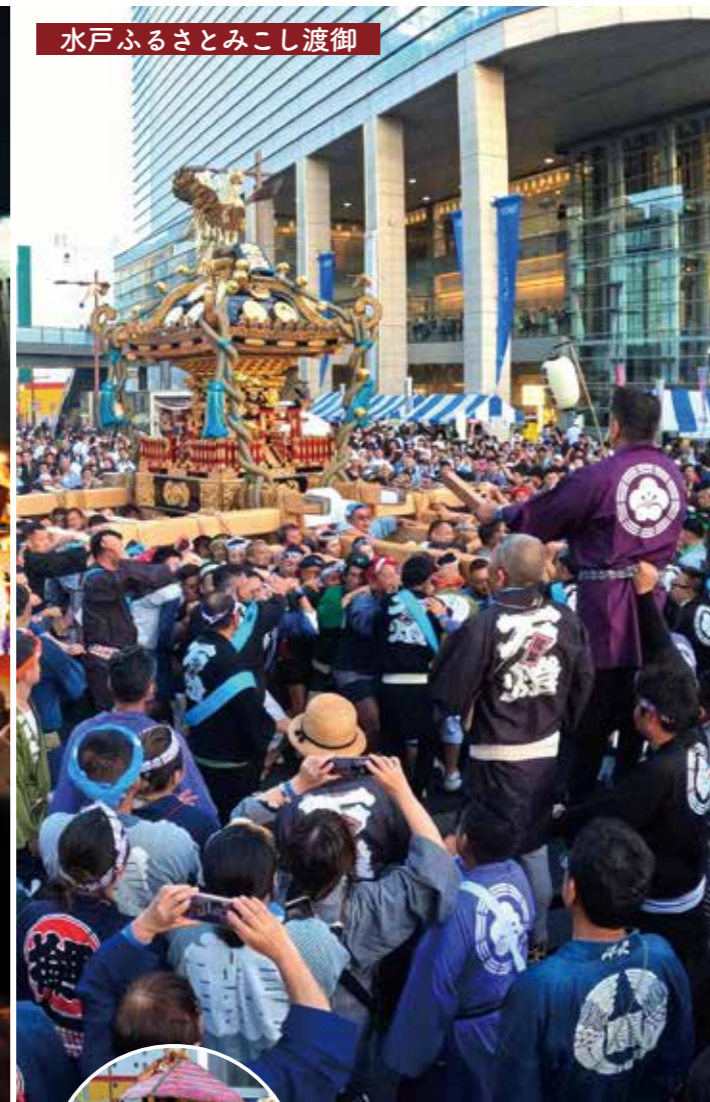
水戸ふるさとみこし渡御