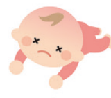
顔色が悪い ぐったりしている