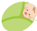
ぐずって眠らない