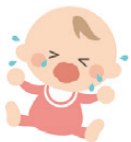
泣き方がおかしい

はっきりとした症状はなくても、下のような状態のときは小児科へ行きましょう。(→小児科一覧 P13)