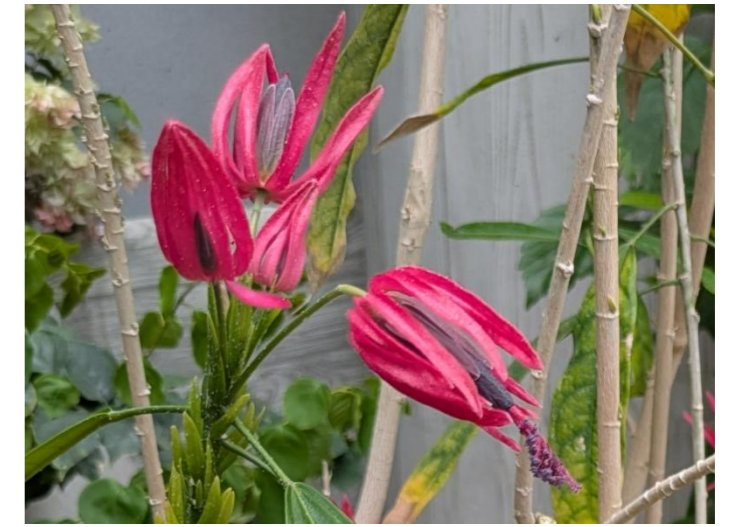
パボニア・インターメディア