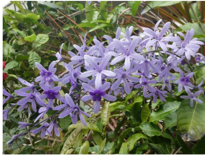
ペトレア・ヴォルビリス