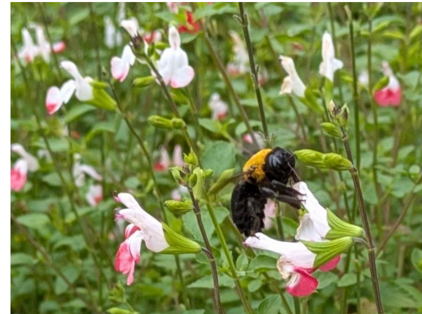
ミクロフィラ' ホットリップス'