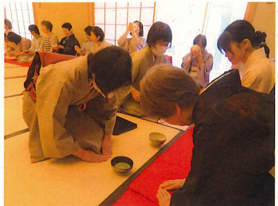
昨年の茶会の様子

3 流派 6月6日: うらせんけ 裏千家、 えどせんけ 江戸千家、 せきしゅうりゅう 石州流 6月7日: おもてせんけ 表千家、各流派合同、江戸千家 ふはくかい 不白会