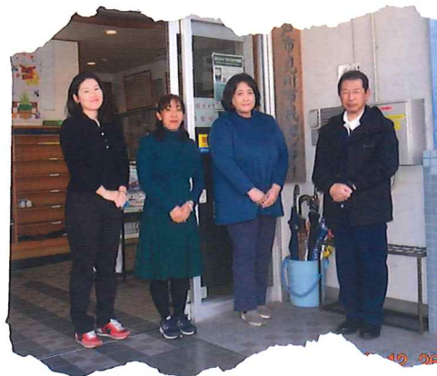
見川市民センター職員のみなさん

今後とも、本地域コミュニティ活動拠点として、皆さまの活動にできる限りご支援し、併せて地域の生涯学習を推進してまいりますので、ご理解、ご協力くださいますようお願い申し上げます。