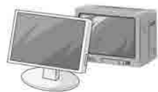
液晶・CRTディスプレイ