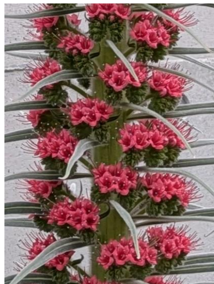
エキウム・ ウィルド