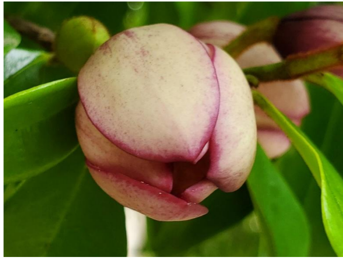
カラタネオガタマ