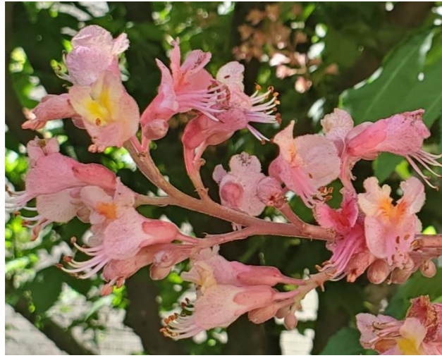
ベニバナトチノキ