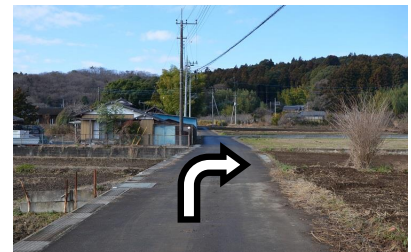
⑤丁字路を右に進んでください。