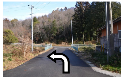
⑦太い道路を左に進んでください。しばらく坂が続きます。