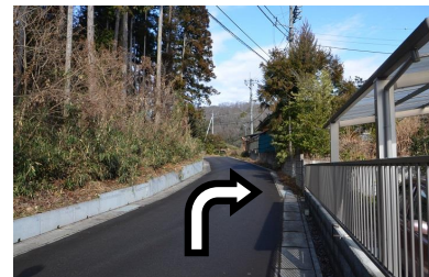
⑥少し先にある丁字路を右に進んでください。