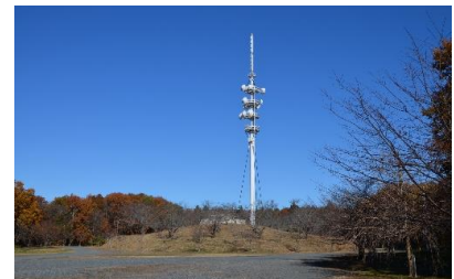
⑫デジタルテレビ送信所のある駐車場に出ます。お疲れ様でした。