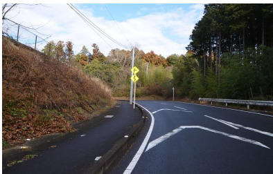
⑧もう少しで坂が終わります。頑張ってください。