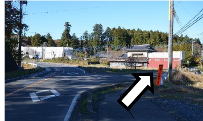
②ふたまたに分かれるところを右に進んでください。