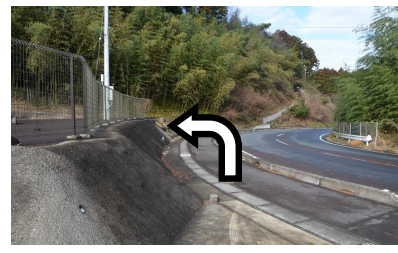
⑩フェンスを過ぎたら左に進んでください。