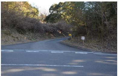
⑨トレイルランコースへの入口です。