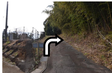
⑪黄色の看板があったら右に進んでください。しばらく坂が続きます。