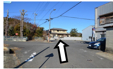
③交差点を直進してください。