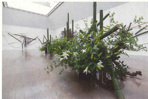
昨年の様子 「第56回水戸市芸術祭いけばな展」