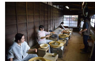
令和7年度開催時の様子