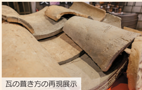
瓦の葺き方の再現展示