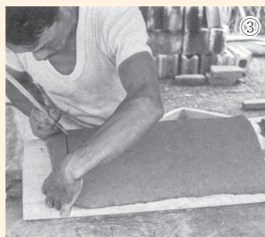
①瓦の出土状況(台渡里官衙遺跡群長者山地区) ②桶巻き作りの再現例 ③一枚作りの再現例