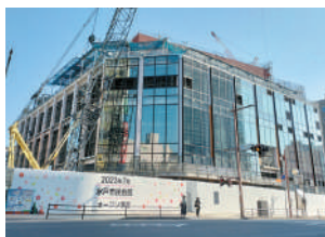
建設中の新市民会館