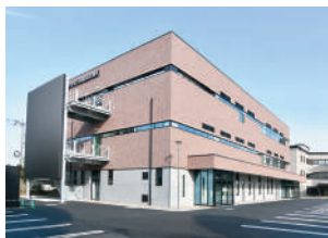
休日夜間緊急診療所