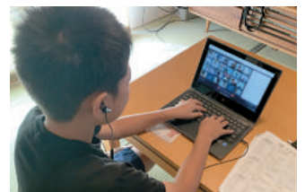
ICTを活用したオンライン授業