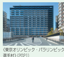
《東京オリンピック・パラリンピック選手村》(2021)

チケットが完売した公演でも、当日券がある場合は、当日の朝9:30からインターネット・電話で受け付けます