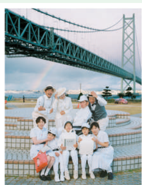
《浅田家全国版/兵庫県》(2021)

※高校生以下、70歳以上、障害者手帳等をお持ちの方(本人と付添人1名)は無料。要証明書。