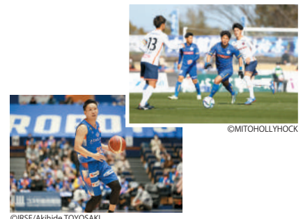
プロスポーツチーム(スポーツの振興) (4-1 市民の多様な活動の推進)

水戸市第6次総合計画—みと魁プラン—2か年実施計画(2022年度～2023年度)の詳細は、市ホームページをご覧ください。右の二次元コードからも確認できます。