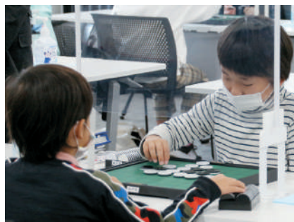
小学生オセロ選手権 (3-1 歴史、文化の継承と振興)