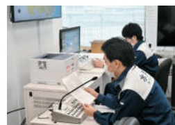
防災ラジオ訓練放送