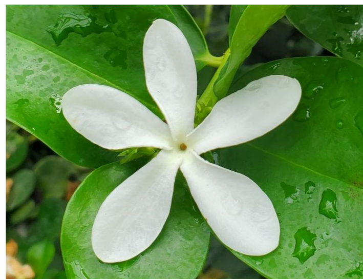
オオバナカリッサ Carissa macrocarpa