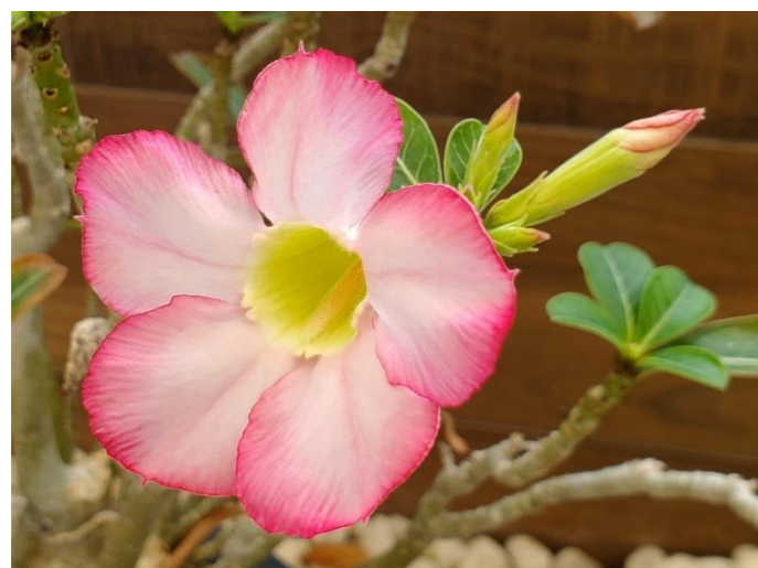
アデニウム・オベスム (砂漠のバラ) Adenium obesum