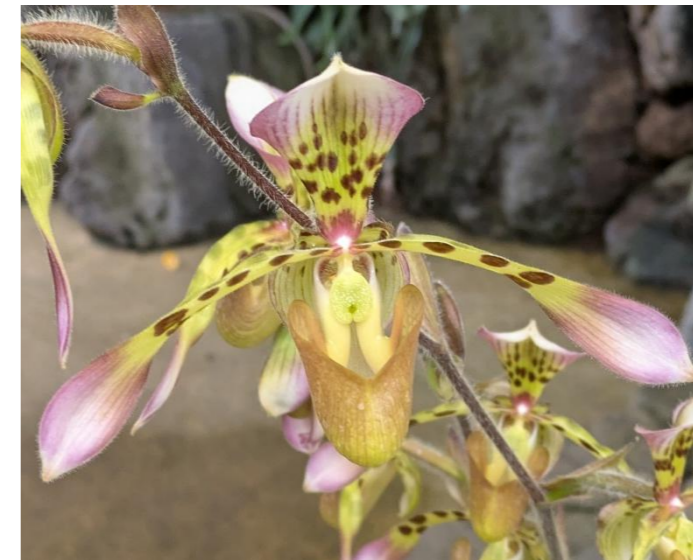
パフィオペディラム プリンス エドワード オフ ヨーク Paphiopedilum