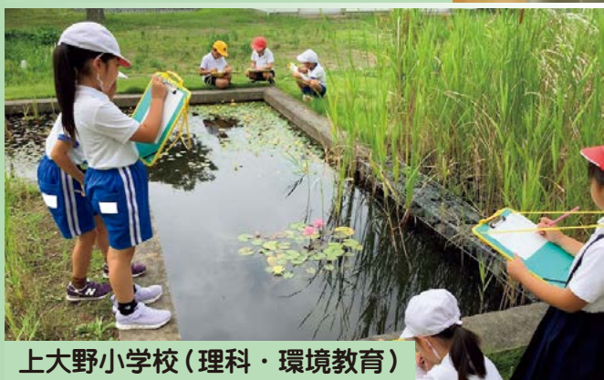
上大野小学校 (理科・環境教育)