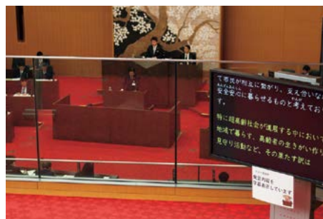
本会議傍聴席に字幕表示システムを導入