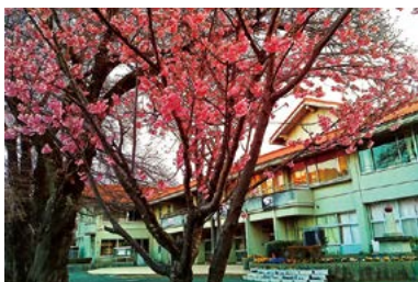
新年度を待つ堀原小学校