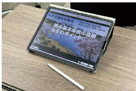
効率的な議会運営に向けてiPadを導入

令和5年4月の水戸市議会議員一般選挙後の6月定例会において特別委員会を設置し、改革の第一歩を踏み出しました。