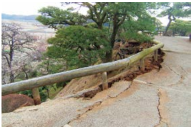
東日本大震災で被災した偕楽園の当時の様子

A (1)東日本大震災の教訓を忘れないために開始したいっせい防災訓練や、洪水・津波の避難訓練などを継続して実施し、ここ数年の訓練参加者は1万人を超えている。(2)避難環境向上として、アレルギー対応食をはじめ、生理用品や防犯ブザー、紙オムツを追加し、備蓄物資の充実を図った。簡易水洗トイレの配備など民間企業との災害協定も強化しており、学校体育館への空調整備など指定避難所の機能強化にも取り組んでいる。今後も、市民が安心を実感できる災害に強いまちの構築に取り組む。