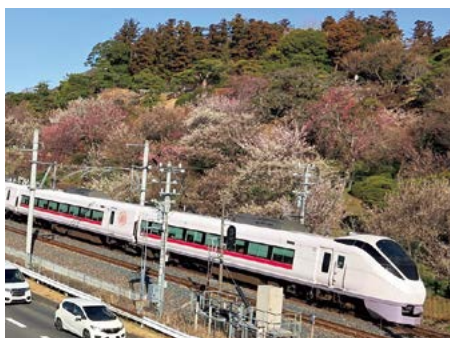
偕楽園沿いを通過する特急列車

A (1)首都圏への通学・通勤が1時間圏内となれば、人口の流入促進・流出抑制につながる。列車の運転速度のアップには、JR東日本から線路の強化や踏切の廃止等、多くの課題を示されている。今後も沿線自治体と連携し、関係機関に力強く要望する。(2)制度創設で、若い世代を呼び込む効果も期待できる。必要な条件等を精査し、限られた予算の中で、各種施策との優先順位や費用対効果を含め、総合的に判断する。