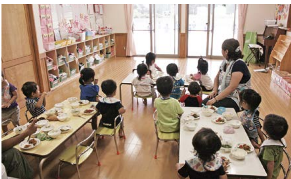
保育園で給食を食べる子どもたち