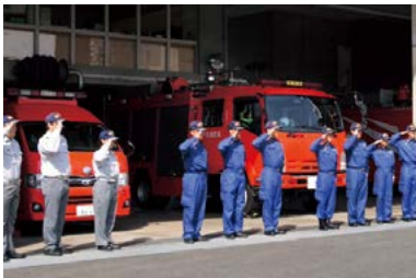
救急業務を担う消防局職員

A (1)通常の救急隊9隊に加え、非常用救急隊など合わせて最大12隊で対応している。救急出動件数、現場到着時間等は令和6年をピークに年々増加していたが、昨年は減少に転じた。(2)11年度には24時間体制の救急車1隊を配備する予定であり、それまでの間、8年度から南消防署に日勤救急隊を配備し、市民サービスの向上を目指す。