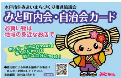
約360店舗で優遇を受けられるカード

A 令和7年4月に、町内会・自治会の活動の活性化に関する条例を施行し、加入促進活動の後押しに貢献している。また、若い世代に町内会等の役割を知ってもらう啓発チラシを作成し、転入者に配布するほか、高齢者世帯の負担軽減事例について、町内会・自治会の運営の手引きの中で紹介している。現状、抜本的な対策はない。今後、も加入促進策について、あらゆる可能性を模索し、積み重ねていく。