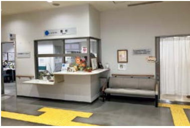
西部基幹相談支援センター(赤塚ミオスビル2階)

A 議員提案は、認知度やイメージの向上等につながるものと認識している。法律に規定された基幹相談支援センターの名称は残しつつ、市民にとって親しみやすく分かりやすい相談窓口となるよう、愛称導入の可能性について検討する。