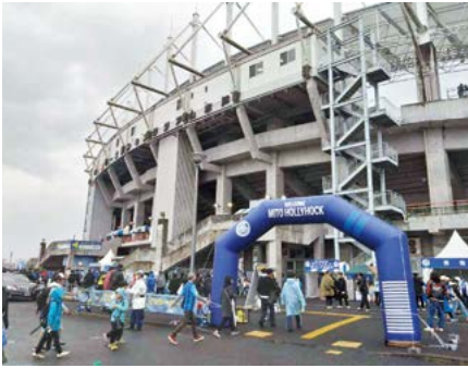
熱狂に包まれたJ1公式戦初となる茨城ダービー

Q ホームスタジアム移転は地域スポーツ振興等に関わるテーマであり、経済波及に資する施策が必要である。(1)移転の所感と今後の連携施策を伺う。(2)本市の掲げる「みるスポーツ」の推進・拡充と、ケーズデンキスタジアムの活用策として、茨城セイバースや水戸シルエラとの連携や、笠松陸上競技場を利用できなくなる各種団体の受け皿の役割が期待できる。見解を伺う。