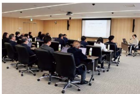
ハラスメント根絶条例を制定し、研修会を開催