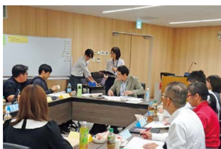
学生と議員の総勢50名で意見交換を実施