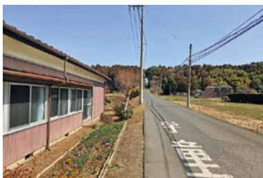
幹線市道35号線の未整備区間(軍民坂)