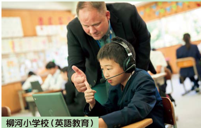
柳河小学校 (英語教育)

小規模特認校では、特色ある教育活動や少人数によるきめ細かな指導を行っています。より就学しやすい環境づくりや教育活動の更なる充実を進めていきます。