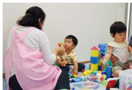
本会議傍聴者向けに託児サービスを開始