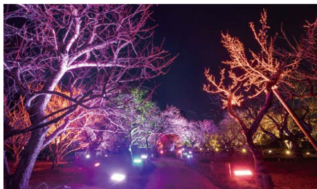
梅まつり期間にライトアップが実施された偕楽園