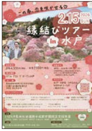
本市開催イベントのチラシ

A 2月の本市開催のマッチングイベ ントでアンケートを実施したとこ ろ、約9割の方からの高評価と、 意欲が高まったとの声をいただい た。行政主体のイベントは安心し て参加できる出会いの機会となり、 結婚への後押しにつながっている。 Q 多様なニーズに対応するため、民 間と連携した取組も必要と考える。 民間主催の婚活イベントへの具 体的な支援について、見解を伺う。 A 営利を目的とせず、出会いの機会 提供に資する取組には、できる限 り支援する。イベントの周知など、 団体の要望に応じた支援を行う。