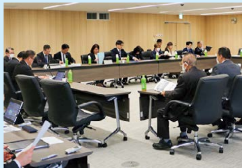
特別委員会における協議

令和8年度も議会改革調査特別委員会の場などで議論を尽くし、議会全体で継続的な改革に取り組んでいきます。