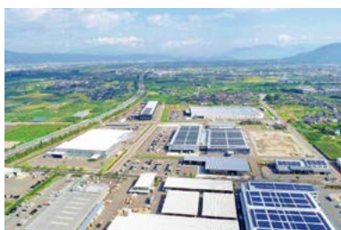
須坂市の「ものづくり産業施設用地」