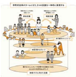
厚生労働省が示すイメージ図

A 様々な教育的ニーズへの対応が求められており、より多くの子どもに対する支援を充実させる。丁寧に周知を行うとともに、効果的な支援となるよう、各学校と連携を図る。効果等を検証し、子どもの自立を目指した教育推進に努める。