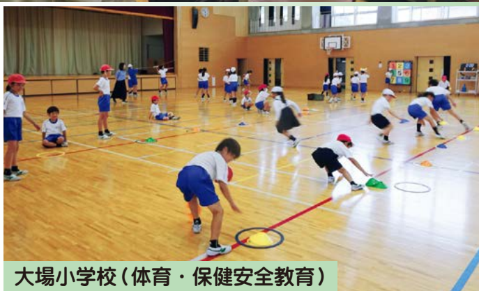
大場小学校 (体育・保健安全教育)