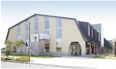
公民連携で整備された紫波町図書館

A 現代の社会問題を解決していける場となるよう検討する。令和8年度に策定する基本構想の中で、有識者会議の意見や市民ニーズを踏まえ、機能や提供サービス、規模や立地場所の考え方をまとめ、運営方式についても検討する。