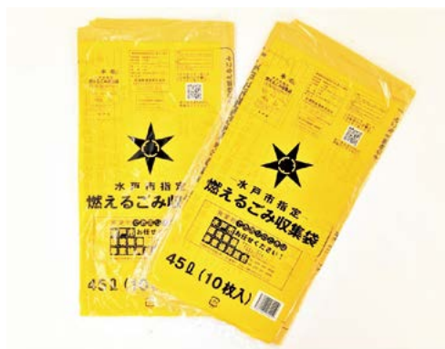
水戸市指定燃えるごみ収集袋(4月からの手数料改定に伴い料金変更)