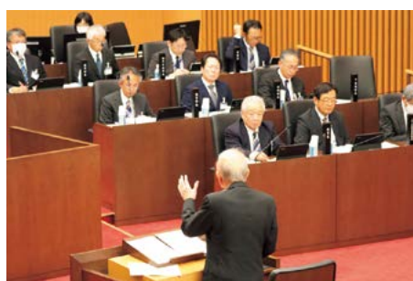
本会議の一般質問に一問一答方式を導入