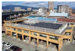
ZEB認証された環境部庁舎