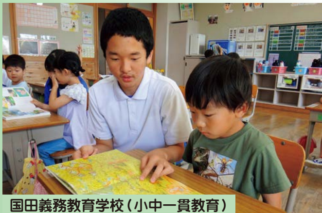
国田義務教育学校 (小中一貫教育)