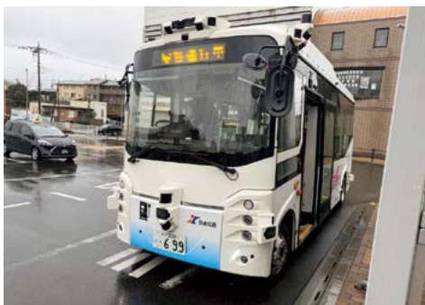
日上市で実証実験中の自動運転バス

A (1)実証実験の視察を行うほか、事業者からヒアリングを実施するなど、情報収集に努めている。引き続き調査研究を進め、利用目的や効果を明確にし、導入の是非を判断する。(2)空白地区の解消に向け、バス交通を基本としながら、水戸タクシー事業を推進するほか、水域をまたぐ幹線系統の運行及び電気バス車両導入に係るバス事業者への支援、シェアサイクル事業の拡充などに取り組む。今後も国や県、事業者など、多様な主体との連携を強化し、公共交通ネットワークの維持、拡充に努める。