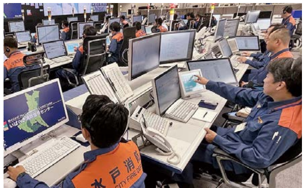
大規模更新を予定するいばらき消防指令センター