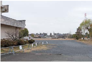
旧国田小中学校跡地

A (1)高速道路のIC周辺等で一定要 件を満たす場合に、開発行為の許 可基準を緩和するが、企業の計画 地が対象区域に含まれない等、適 合しない事例があった。(2)起点と なるICを8か所に増やし、対象 区域を各起点から半径3kmに拡大 するなど、要件を緩和した。(3)モ デル地区である国田地区と意見交 換を継続し、地域の土地利用の在 り方をともに考え、それを実現す るために土地利用のルールづくり が必要な場合には、地区計画など の具体的な計画内容に反映する。