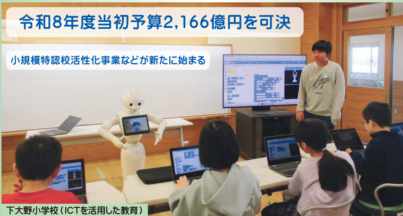
下大野小学校 (ICTを活用した教育)