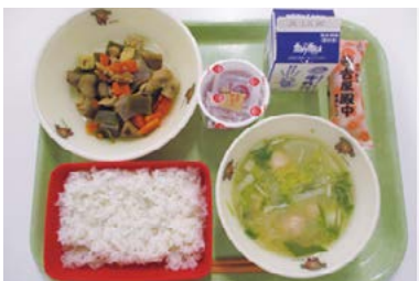
本市が提供する学校給食

A (1)毎年度アンケートを実施し、食物アレルギーの状況を把握している。人数はほぼ横ばいだが、原因食物は多種多様で、対応が複雑化している。(2)無償化の効果を十分に享受できておらず、対応すべき課題と認識している。(3)個別の対応が必要であり、課題を整理しながら、他自治体における先行事例を調査するなど、支援策について検討を行う。