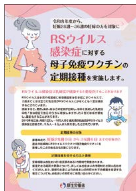
RSウイルスワクチンの案内と感染症対策の周知