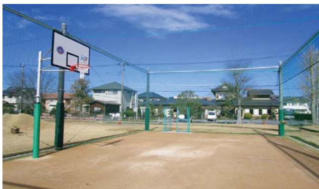
防球ネットを設置した諏訪児童公園