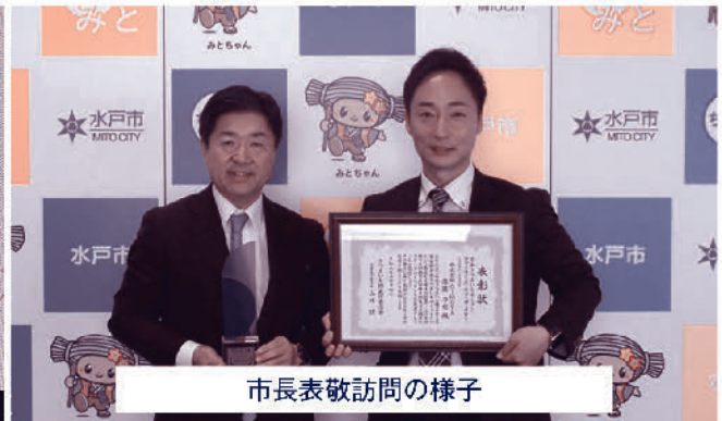
市長表敬訪問の様子