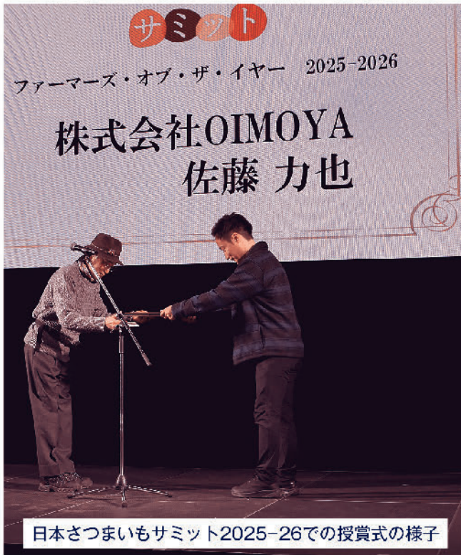
日本さつまいもサミット2025-26での授賞式の様子