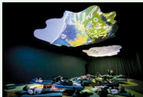
(4階から穏やかさへ向かって)2016年(映像作品) オーストラリア現代美術館での展示風景、2017年

混雑を避けるため、9月18日(土)・19日(日)・20日(月)、10月9日(土)・10日(日)・16日(土)・17日(日)は、優先入場予約実施日とします。予約方法など、詳細は、お問合せください。