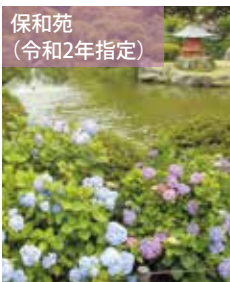
保和苑 (令和2年指定)

「水戸市地域文化財」は、市内のそれぞれの地域で大切に守り伝えられている文化財を後世に残すため、平成30年度から始まった制度です。認定を受けた地域文化財には、市が修理や保存・活用方法について助言や情報提供をするほか、案内板の設置、教育活動やイベントなどで活用していきます。ただし、修理や保存などに関する補助はありません。