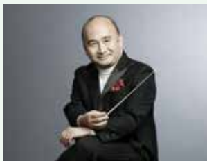
広上淳一

曲目 シューベルト：交響曲 第5番 変ロ長調 D485 メンデルスゾーン：交響曲 第3番 イ短調 作品56 <スコットランド>