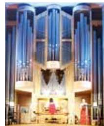
2017年クリスマス公演の様子