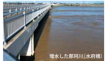
増水した那珂川(水府橋)

市から避難情報が発令されていなくても、不安を感じたら、自らの判断で避難行動を開始しましょう。