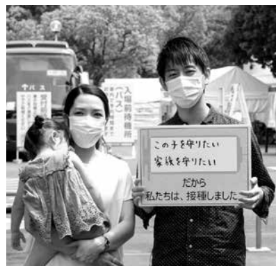
左…ワクチン接種を受けた水戸市在住夫婦 右…東京五輪フェンシング男子フルール団体日本代表の永野雄大選手