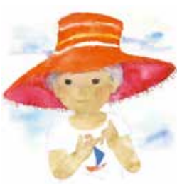
赤い帽子の男の子 1971年 ちひろ美術館所蔵

生涯にわたって子どもを描き続けた画家、いわさきちひろの作品、約120点を展示します。 期／7月24日(土)～8月29日(日) 時／午前9時30分～午後5時(入場は午後4時30分まで) 場／県近代美術館 料／一般1100円、満70歳以上550円、高校・大学生870円、小・中学生490円 ※各種割引やなど、詳細は、お問合せください。 ▼優先入場予約ができます 事前に、同館ホームページ(htt p://www.modernartmuseum.dk.ed.jp)で申込み、指定した時間に優先的に観覧できます。申込方法など、詳細は、同館ホームページをご覧ください。 問／同館(☎243-5111)または市文化交流課(☎291-3846)