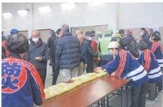
非常食マジックライス