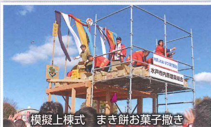
模擬上棟式 まき餅お菓子撒き