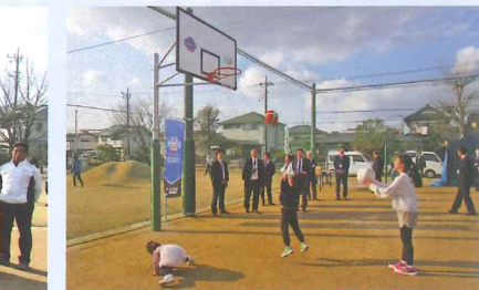
茨城新聞掲載令和8年2月27日（金）