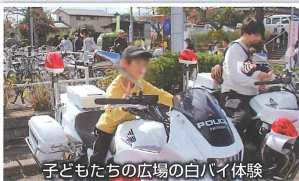
子どもたちの広場の白バイ体験