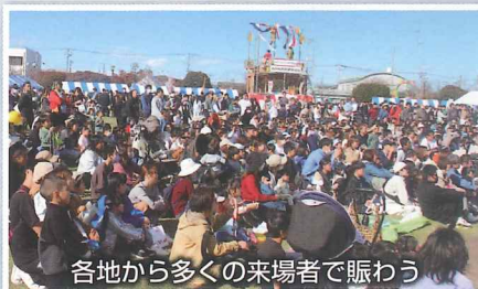
各地から多くの来場者で賑わう