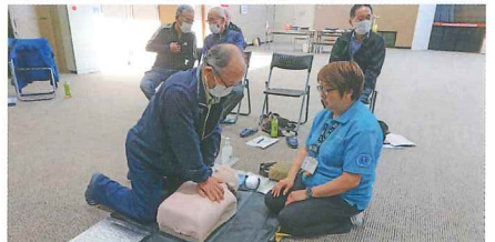
自治会長・内原地区女性防火クラブ皆さんが参加 内原市民センターホールにて