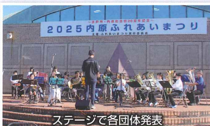
ステージで各団体発表