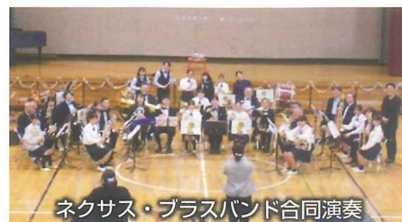
ネクサス・ブラスバンド合同演奏