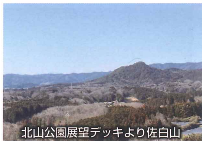
北山公園展望デッキより佐白山

宍戸駅周辺には、唯信寺、光明寺、完全寺など見ごたえのあるたくさんのお寺や神社があります。北に進むと白鳥湖があり、湖畔沿いに整備されたハイキングコースをのんびり歩きながら、ビオトープ天神の里や北山公園に進みます。北山公園では新池を湖畔沿いに歩き、展望台に向かいます。展望台では、佐白山、筑波山、日光連山、日立アルプスなど360度のパノラマを楽しむことができます。そこから、展望台で見た佐白山向かって、ひたすら舗装道路を歩きます。佐白山は標高182mで自然の植物園とも言われ何回行っても飽きません。佐白山から陶芸美術館や日動美術館を經由して、稲荷神社