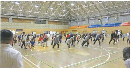
柔軟体操スポーツ大会スタート