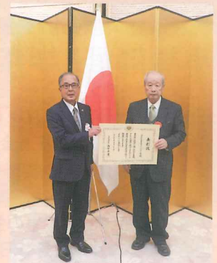
首相官邸ホールにて