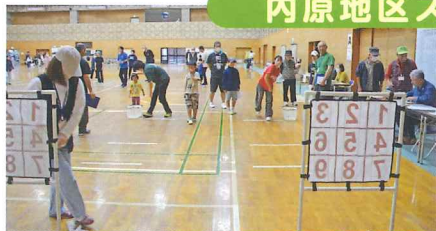
ストライクアウト