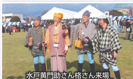
水戸黄門助さん格さん来場

令和7年11月3日（月）晴天、牛串試食に長蛇の列、 模擬店33店舗出店大盛況の中開催