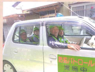
青パトロール防犯活動