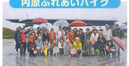
内原ふれあいハイク海浜公園前集合写真