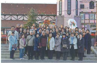
東京ドイツ村にて

令和8年1月18日(日) 大型観光バスで参加者48名にて視察研修会を実施しました。道の駅最強ランキング「道の駅保田小学校」、坂東33観音第33番札所の「那古寺」を訪れ、房総最大級のお食事処海鮮バーベキュー「たてやま」にて昼食、その後東京ドイツ村にて幻想的な雰囲気の大規模なイルミネーションを満喫しました。