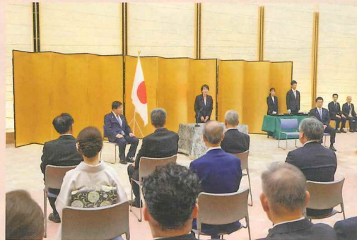
首相官邸2F大ホール表彰式