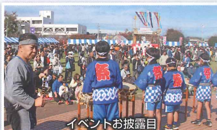
イベントお披露目