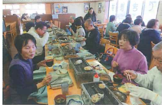
海鮮バーベキュー