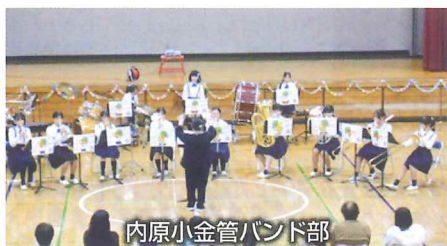
内原小金管バンド部

2月15日(日)に、今年度で活動を終える水戸市立内原小学校の金管バンド部の「ありがとうラストコンサート」が行われました。ゲストのネクサス・ブラスバンドさんの素敵な演奏やダンス隊のパフォーマンス。そして、会場の皆さんと校歌を歌ったり、みとちゃんダンスを踊ったりして、会場は大盛り上がりでした。今まで長い間内原小学校金管バンド部を応援して下さった皆様、本当にありがとうございました。