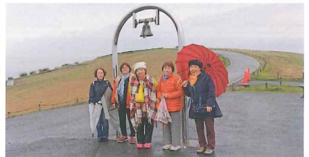
金の鳴る丘 はい!チーズ