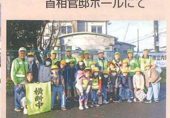
内原小前記念撮影