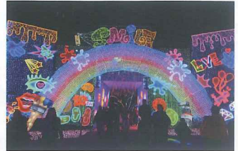
イルミネーション