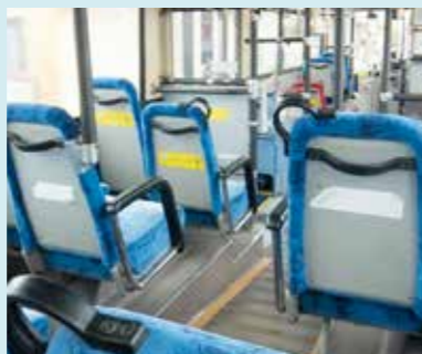
※鉄道、バスなどで実施。