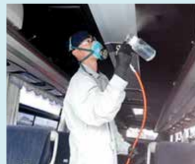
※鉄道、高速バスなどで実施。