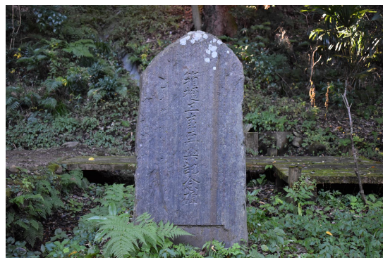
大正 7 年の箱樋工事記念碑