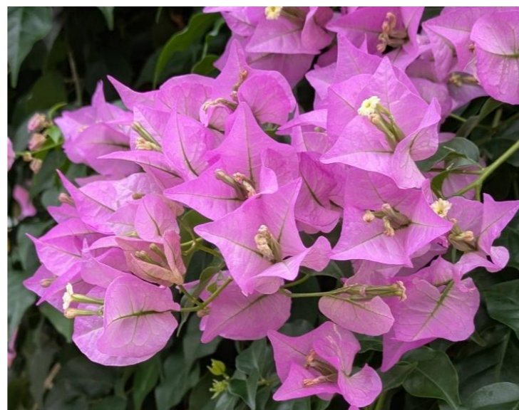
ブーゲンビリア Bougainvillea cv.