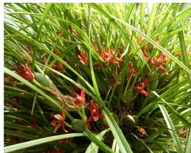
マキシラリア・テヌイフォリア Maxillaria tenuifolia