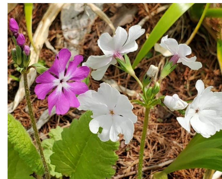
サクラソウ Primula sieboldii cv.