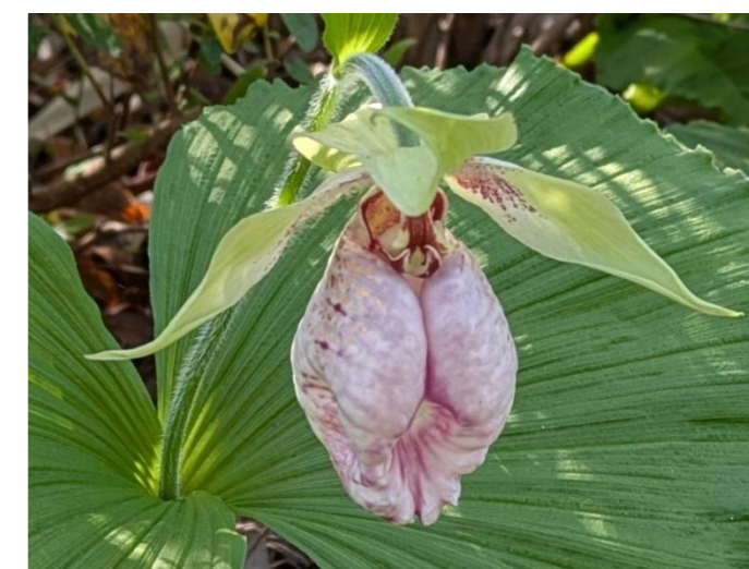
クマガイソウ Cypripedium japonicum Thunb.