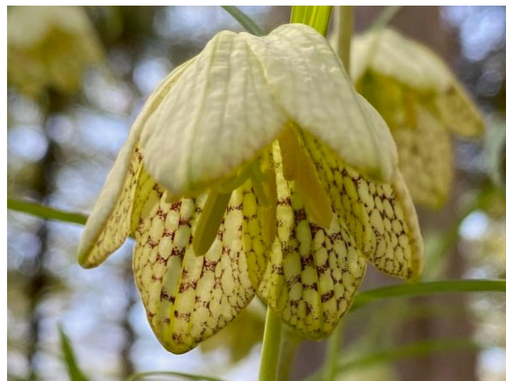
バイモ Fritillaria verticillata var. thunbergii