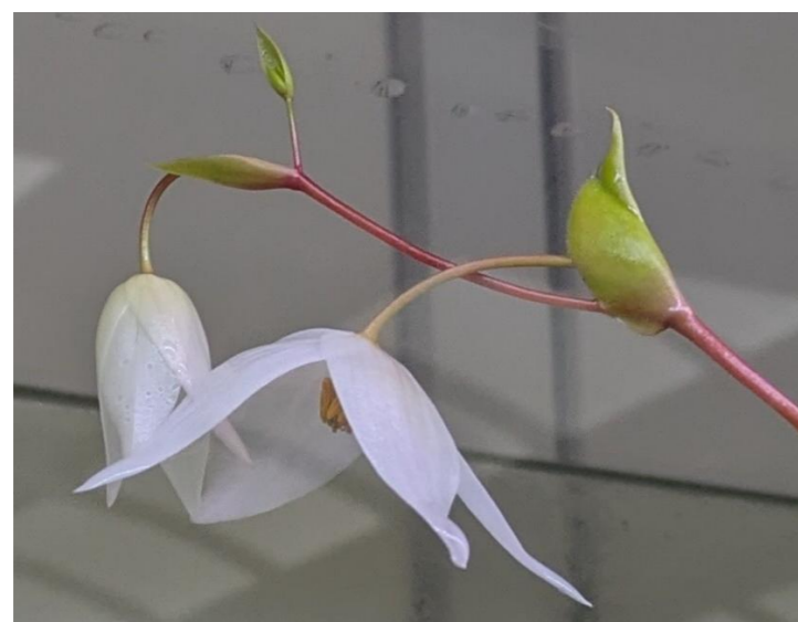
ヘリアンフォラ・ヌタンズ Heliamphora nutans