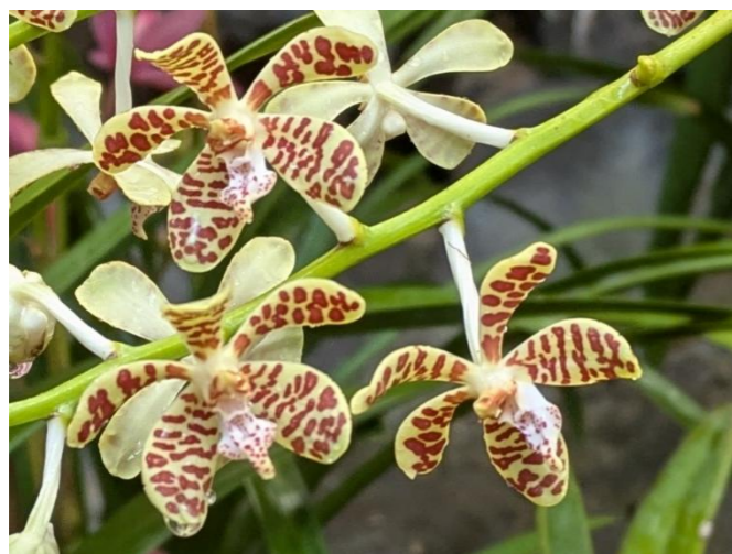
イリオモテラン Trichoglottis ionosma