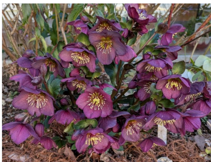
クリスマスローズ Helleborus