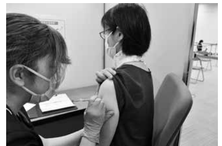
ワクチン接種の様子

※体調が悪いときなどは、接種を控えてください。予約のキャンセルなどは、電話かインターネットで行えます。