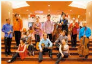
アンサンブル・ノマド