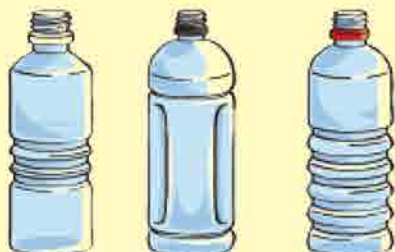
飲料 酒類 醤油など