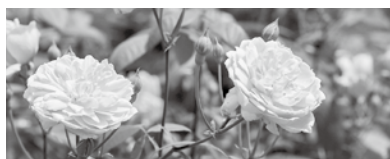
モーティマー・サックラー 場所：入口付近のオーバブリッジ