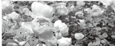
スカイラク 場所：テラスガーデンの滝の上