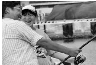
昨年度の最優秀作品 「週末の父は私の先生」

要件 ／①写真プリント(家庭用プリンタでの出力も可)、または、写真データをメールに添付