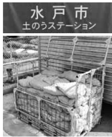
水戸市 土のうステーション

5月30日は「ごみゼロの日」 5月30日は、ごみの減量化と再資源化をあらためて意識してみませんか。 空きびん、空き缶、新聞、雑誌などのほか、「ペットボトル」「白色トレイ」「プラスチック製容器包装」も資源物として収集を行っています。資源物として出されたものは、さまざまな製品や原料に生まれ変わるため、限りある資源を有効に活用することができ、ごみの減量にもつながります。今年の4月からは「プラスチック製容器包装」の回収回数が増え、より資