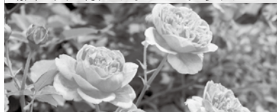
ボスコベル 場所：入口付近のオーバブリッジ