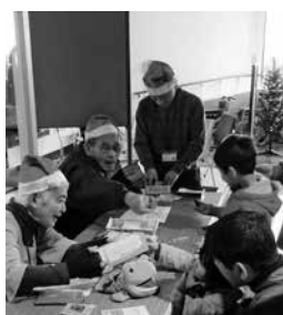
おもちゃの交換会でのボランティアの様子

活動期日/土・日曜日、祝日、展覧会会期中 活動時間/午前9時30分~午後4時30分 場/市立博物館 対/18歳以上の心身ともに健康な方 人/若干名 申/問/4月24日(土)~5月21日(金)に、電話で、市立博物館(☎226-6521)へ ※詳細は、お問合せください。