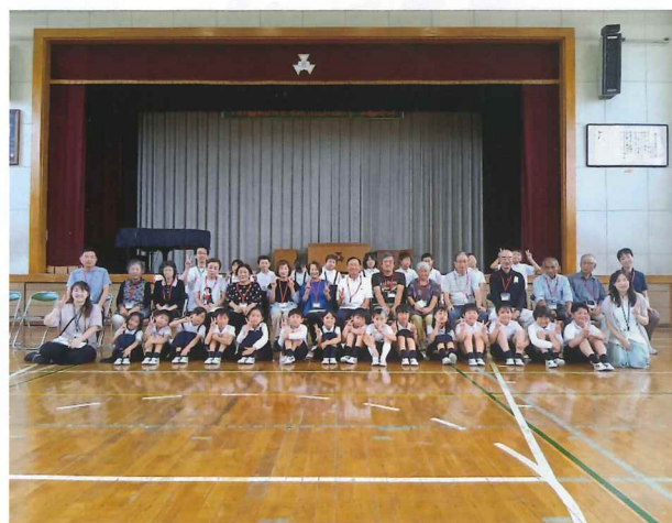
エンジョイヤなかわワールド 参加者全員の集合写真

昨年度の川角から引き継ぎ、今年度から柳河支部を担当させていただきます。地域の皆さまには、常日頃から水戸市社会福祉協議会の活動にご理解とご支援を賜り、厚く御礼申し上げます。 今年度も残りわずかとなりましたが、私自身、小学生との昔遊びイベント「エンジョイヤなかわワールド」、地域住民同士の交流を深める「柳河ふれあいまつり」、支部主催の敬老慶祝事業「福寿のつどい」など各種行事に参加をとおして、柳河地区の優しさを感じられた1年となりました。 これからも、支部の皆さまと力を合わせ、地域ニーズに即した支援や地域資源の発掘と活用、そして、何よりも誰もが安心して暮らせる地域社会づくりに貢献できますよう、微力ではありますが、精一杯務めて参りますので、どうぞよろしくお願います。