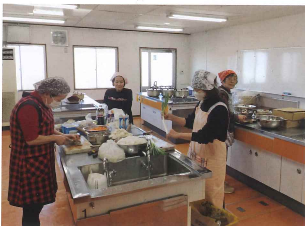
愛情込めて食事を作っている女性会の方