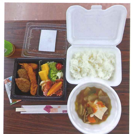
地元の新米、けんちん汁もおいしい