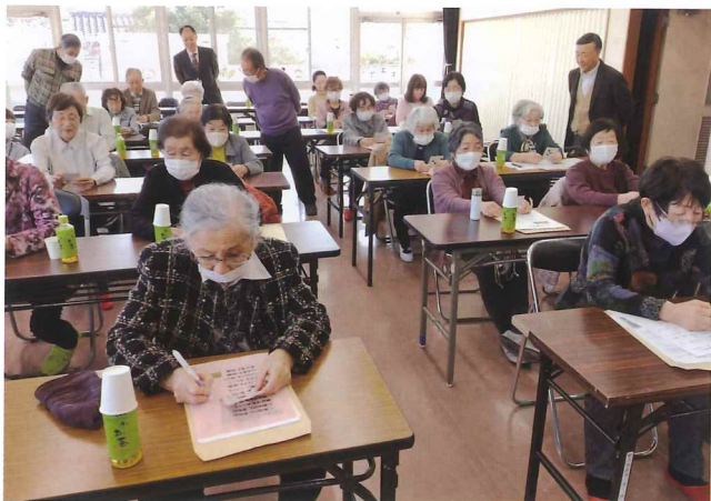
ビンゴゲームで数字とにらめっこ

アンケートの結果、一番好評だったのが「楽器演奏」でした。次回もお願いしたいと思います。