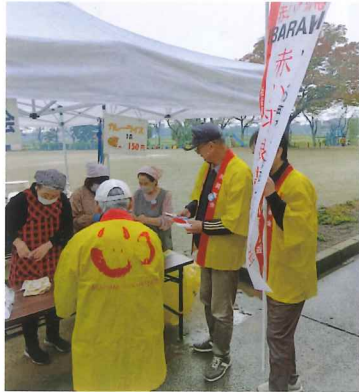
赤い羽根イベント募金活動 11,949円募金が集まりました。 ご協力ありがとうございました。