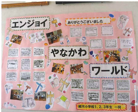
参加した柳河小学校児童の寄せ書き (只今、柳河市民センターロビーに掲示中)