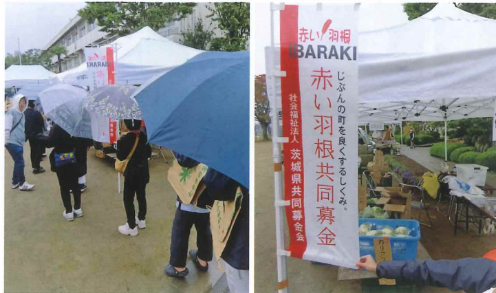
雨の中長蛇の列・共同募金のほり旗 一番人気は柳河産「土ネギ」