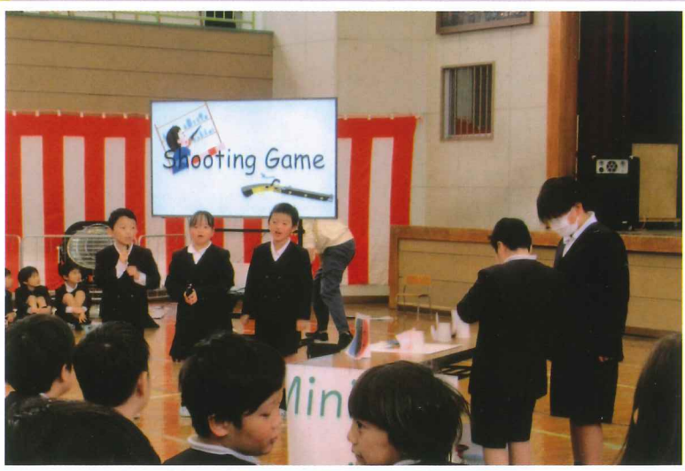
特認校の特色を生かした発表