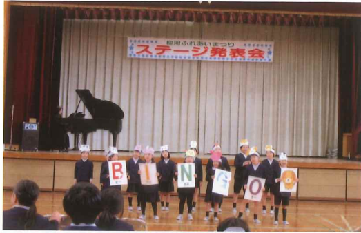
たくさん練習したよ