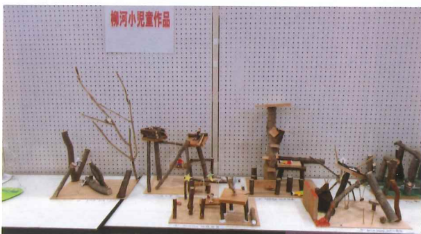
考えたかわいい作品