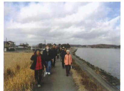
豊かな自然の中 足取りも軽く

会場を後にし、ポケットファームどきどきにて買物を楽しむこともでき、大満足の日でした。次回の歩く会も多くの方のご参加をお待ちしております。