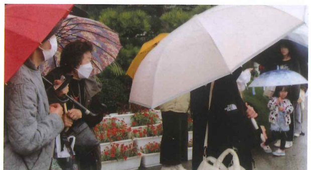
雨の中ありがとう