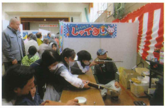
支える手にも思いが入って