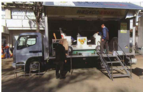
シートベルトコンビンサー体験

今年度も、水戸市消防本部、防災危機管理課、茨城県交通安全協会、その他、関係各位の皆様のご協力のもと、貴重な体験をするこ