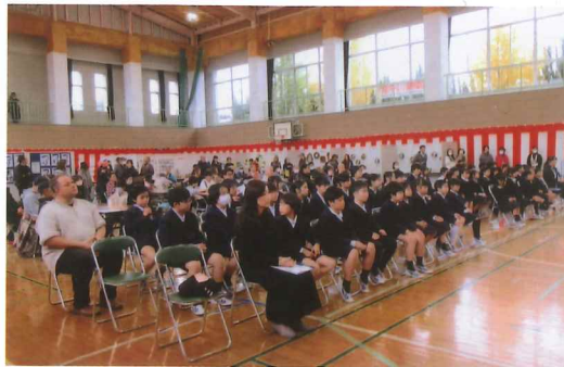
開式前のわくわく

あいにくの雨となつてしまつた今回の柳河ふれあいまつり、模擬店、ステージ発表、作品展示などで交流を深めた一日となりました。