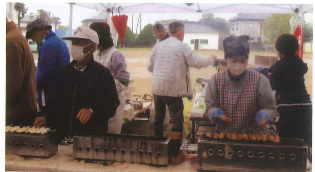
一番人気のやきとり