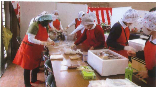
お餅だけは中で販売

あいにくの雨となつてしまつた今回の柳河ふれあいまつり、模擬店、ステージ発表、作品展示などで交流を深めた一日となりました。