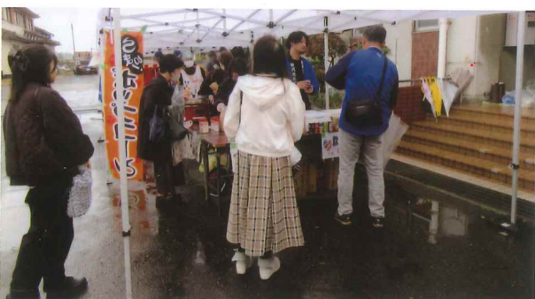
寒い時は温かい物で