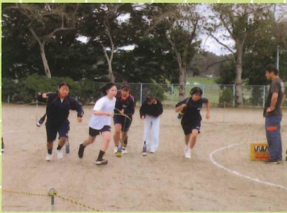
ゴールヘダッシュ!!