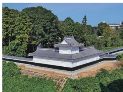
二の丸角櫓(すみやぐら)(3-1 歴史、文化の継承と振興)