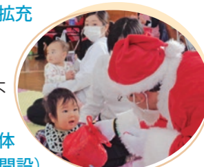
市民センター子育て広場