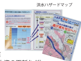
洪水ハザードマップ