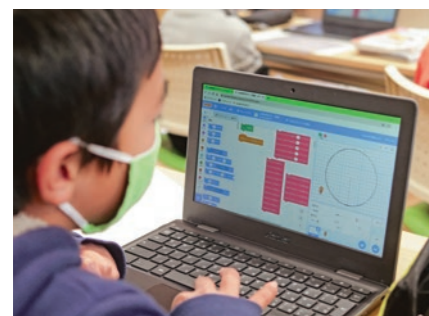
ICTを活用した授業(1-1 未来を担う子どもたちの育成)