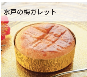
水戸の梅ガレット