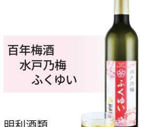
百年梅酒 水戸乃梅 ふくゆい