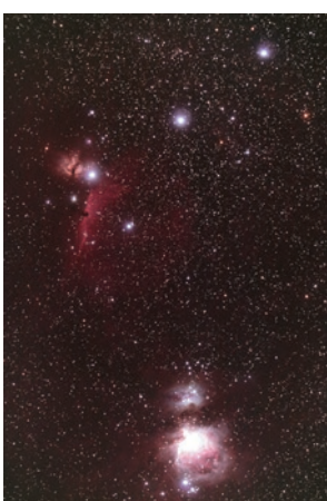
▶長時間露光で撮影したオリオン座の南(下半分)