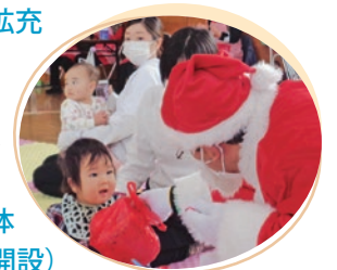
市民センター子育て広場