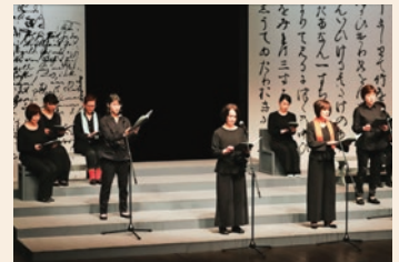
平成29年度の発表公演より