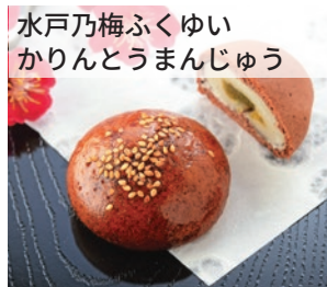
水戸乃梅ふくゆい かりんとうまんじゅう