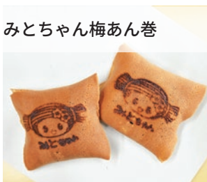
みとちゃん梅あん巻