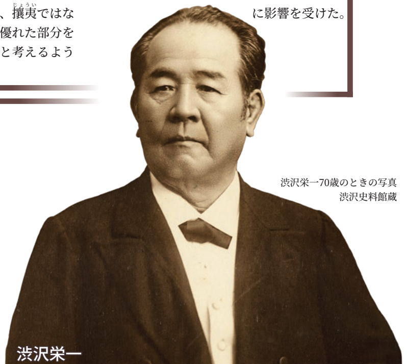
渋沢栄一70歳のときの写真

※1月21日時点の情報です。新型コロナウイルス感染症の拡大防止のため、開催期間などが変更となる場合があります。