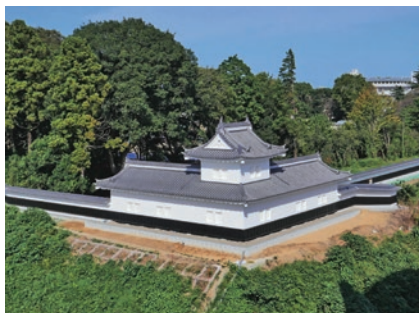
二の丸角櫓(すみやぐら)(3-1 歴史、文化の継承と振興)