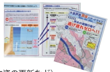
洪水ハザードマップ