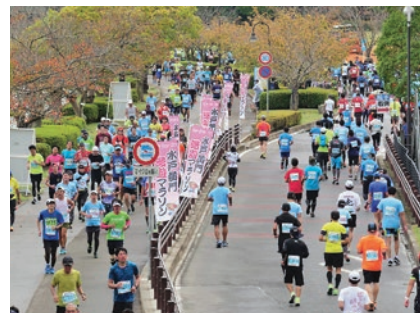
水戸黄門漫遊マラソン(4-1 市民の多様な活動の推進)

水戸市第6次総合計画—みと魁プラン—3か年実施計画(2021年度～2023年度)の詳細は、市ホームページをご覧ください。政策企画課(☎232-9104)にお問合せください。右の二次元コードからも確認できます。