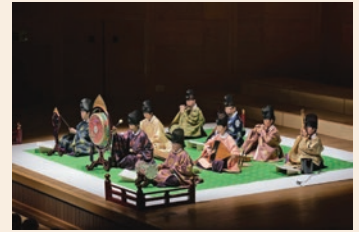
「今昔雅楽集 一、七夕の宴」より