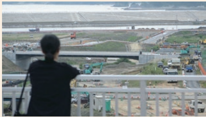
小森はるか+瀬尾夏美 《二重のまち/交代地のうたを編む》2019 ©Komori Haruka + Seo Natsumi