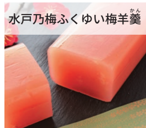
水戸乃梅ふくゆい梅羊羹