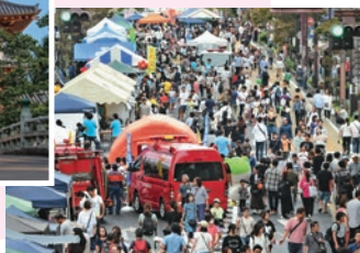
水戸まちなかフェスティバル