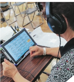
物忘れ度測定の様子

とアリーナ 対／市内に居住する65歳以上の方 人／60名(定員になり次第締切り) 料 ／無料 申・問 ／3月9日(火)までに、電話で、地域支援センター(☎297・5903)へ