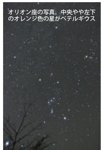
オリオン座の写真。中央やや左下のオレンジ色の星がベテルギウス