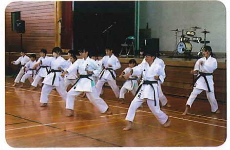
ピタリそろって決まりました