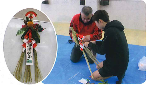
この場所でのいいのかな