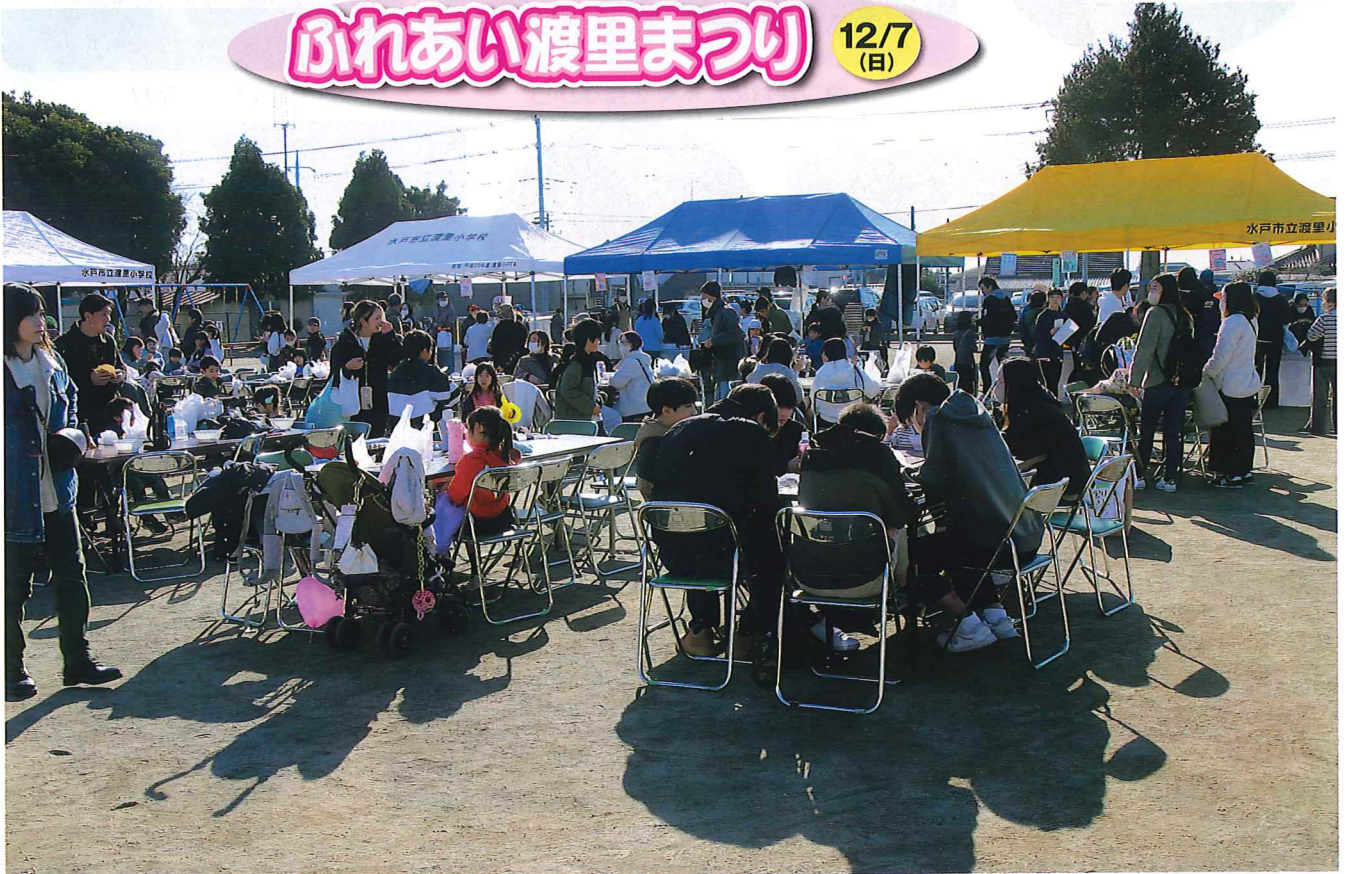
たくさんのお客さんでにぎわうイートイン