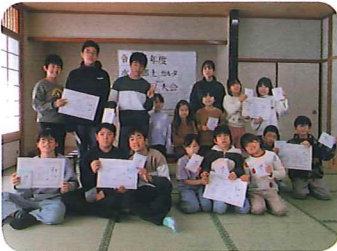
みんなよくがんばりました