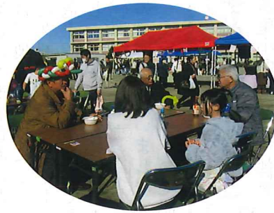
風船の帽子がお似合いです