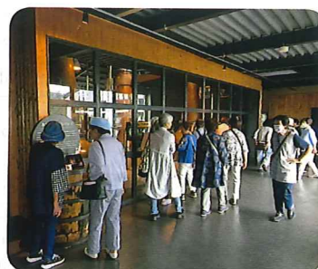
クラフトウイスキー製造工場

わたしは、渡里市民センターで料理教室に参加しました。野菜スープやシフォンケーキを作りました。ちょうどクリスマスだったので、持ち帰ったシフォンケーキは家族へのクリスマスプレゼントになりました。みんな喜んでくれてうれしかったです。料理は、切るのが難しかったです。けど、自分で作るの楽しかったです。おいしかったです。