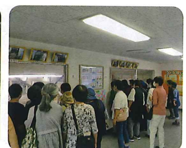
甘い香り漂うクッキー製造工場