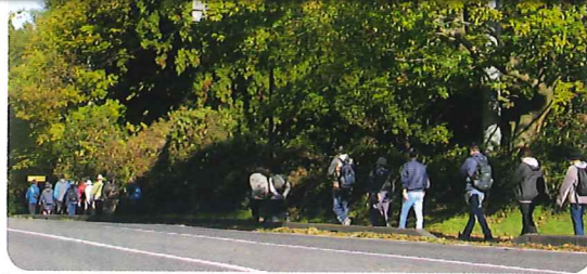
色づき始めた木々を見ながら