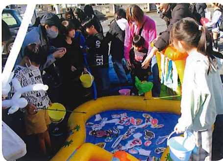
大人気の魚釣りコーナー

私はボランティアとして初めてこのお祭りに参加し、屋台のお手伝いをしました。お祭りが始まる前から担当の屋台の準備をして、お祭りの最中は他の屋台のお手伝いもしました。優しく指導をしてくれた大人の方にはとても感謝しています。また、このお祭りには野菜を販売するエリアがあることを知って、次にお祭りに参加する時には親も連れて行きたいなと思いました。一つ心残りなのは、私が担当していた屋台の食べ物、休憩のときに買えなかったことが少し残念でした。