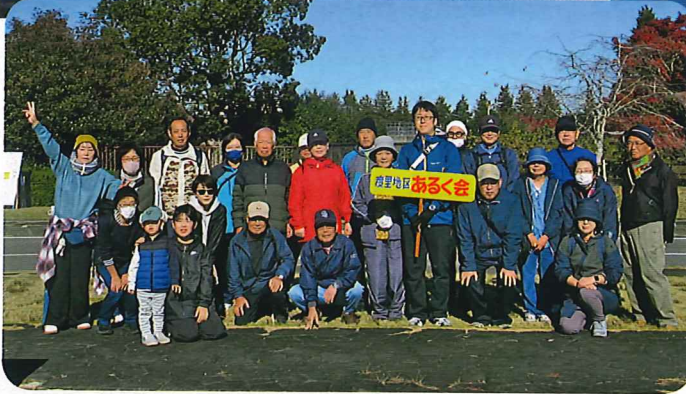
全員集合「ハイチーズ!!」