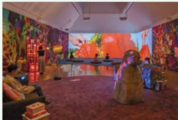
当館での展示風景(2021年) 撮影: 川村麻純 © Pipilotti Rist, All images courtesy the artist, Hauser & Wirth and Luhning Augustine

混雑を避けるため、10月9日(土)・10日(日)・16日(土)・17日(日)は、優先入場予約実施日とします。予約方法など、詳細は、お問合せください。