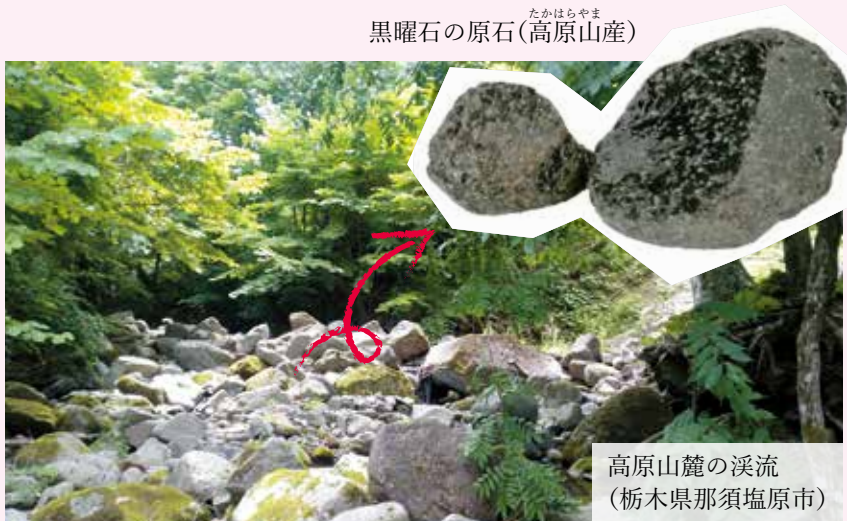
たかはらやま 黒曜石の原石(高原山産)