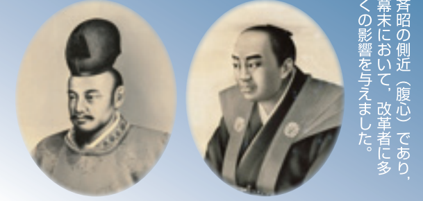
水戸藩第九代藩主 徳川斉昭