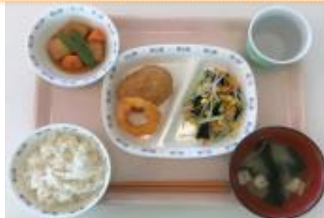
B コロッケ&イカリングランチ