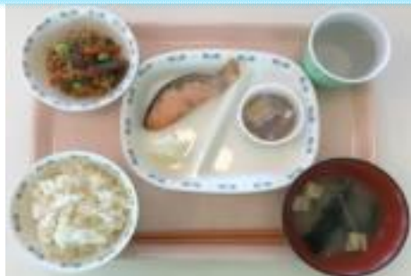
鮭・納豆・煮物・ご飯・みそ汁