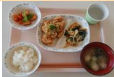
F 鶏の竜田揚げおろしポン酢ランチ