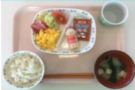
スクランブルエッグ・ベーコン・サラダ ふりかけ・乳酸菌飲料・ご飯・みそ汁