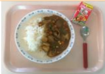
A カレーライスランチ