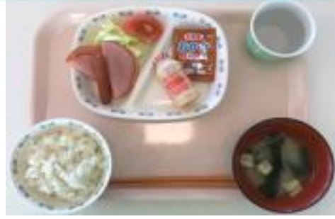
ハム・ウインナー・サラダ・ふりかけ 乳酸菌飲料・ご飯・みそ汁