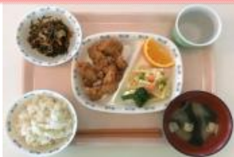
C 鶏のから揚げ定食