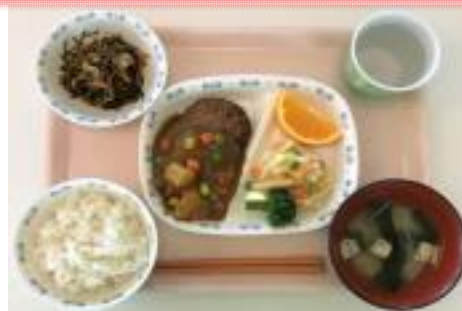
D カレーハンバーグ定食