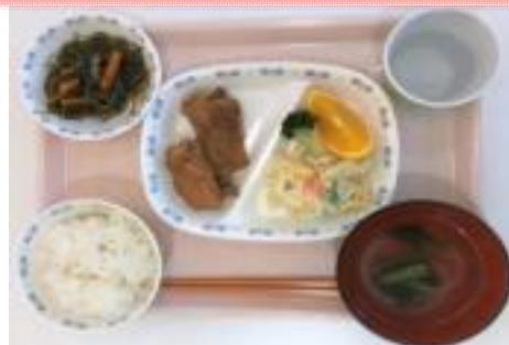
B 照り焼きチキン定食