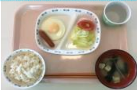
目玉焼き・ウインナー・サラダ ご飯・みそ汁