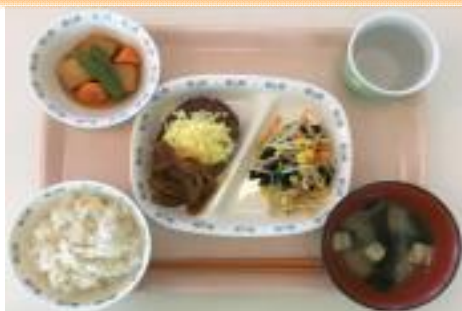
C チーズハンバーグランチ