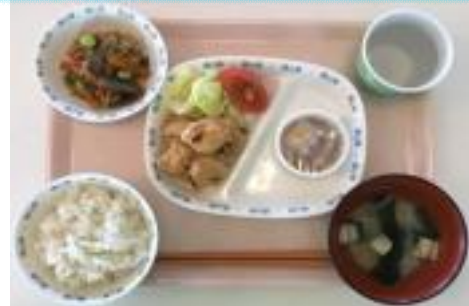
鶏味噌焼き・サラダ・納豆 煮物・ご飯・みそ汁