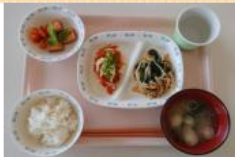
E 魚のピザソース焼きランチ