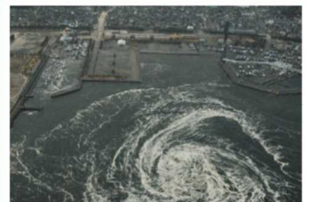
津波により発生した渦潮（大洗町）