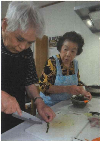
昨年のテーマ「私の身近にある男女平等参画」

イクボス=職場で、従業員や部下の育児や産休など個人のキャリアを尊重する上司(ボス)