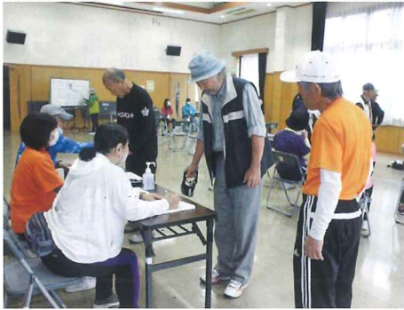
こん身の力で握力測定

百人以上の事前登録と沢山の当日参加者が競技とゲームを楽しみました。スポーツを通して、地域や家族の絆が深まった一日でした。