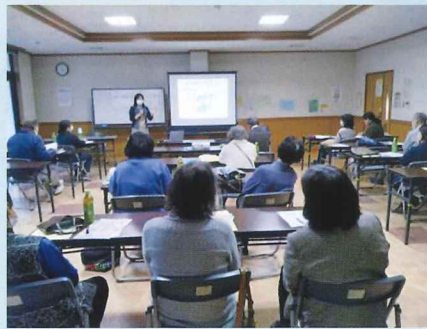
「だまされない!」と真剣に受講

ご近所安心ネットは住み慣れたまちで誰もが安心して生活を続けられるための地域づくりを目指しています。今年度は11月21日「高齢者の消費者トラブル」をテーマに講演会を双葉台市民センターにて開催し、30名が受講しました。