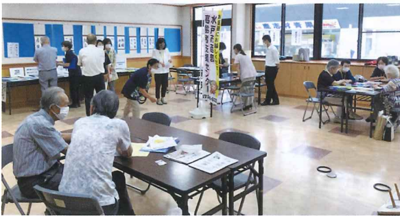
オセロで脳を、輪投げで手足と心を活性化。西部支援センターで悩み相談も・・・

5名の参加者から、福寿のつどいの感想や日々の感動を俳句、川柳でご披露頂きました。