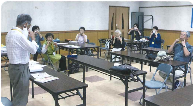
「ベロトレ」で滑舌アップ、誤えんを防止