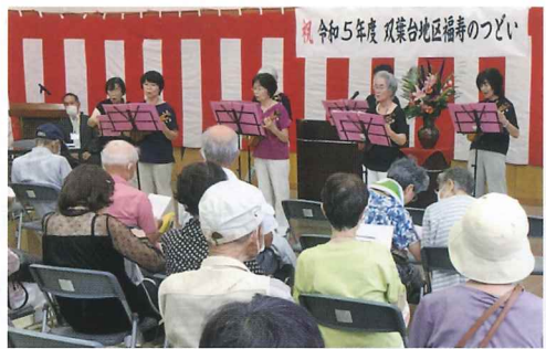
つどい開始に先だって静かにゆっくりと高齢者を応援