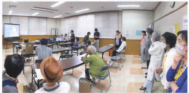
昭和の名曲から最新曲、あの懐かしい唱歌まで熱唱しました