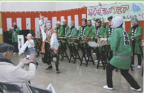
(左上から) 水戸内原吹奏楽団演奏、高齢者クラブ連合会による遊び体験コーナー、双葉祭囃子愛好会、社会福祉協議会双葉台支部による歳末助け合い募金活動