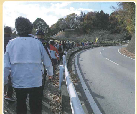
12月3日、晴天の下、双葉台地区市民歩く会が楮川ダムコースで実施されました。参加者は50名。受付を済ませ、ウォーキングクラブ指導者による準備運動をして出発。(右ページへ)