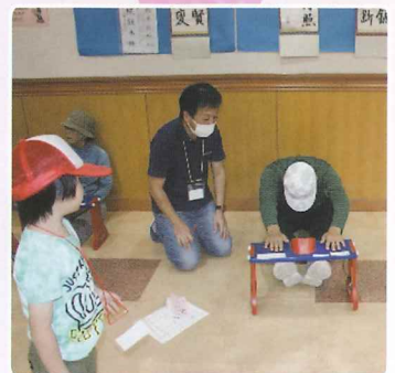
小学生から高齢者まで、仲間といろいろなスポーツを楽しみました ~上段左から、選手宣誓、花壇コンクール表彰、中段左から準備運動、グラウンドゴルフ、下段左から魚釣り、フライングディスク、体力測定(長座体前屈)~