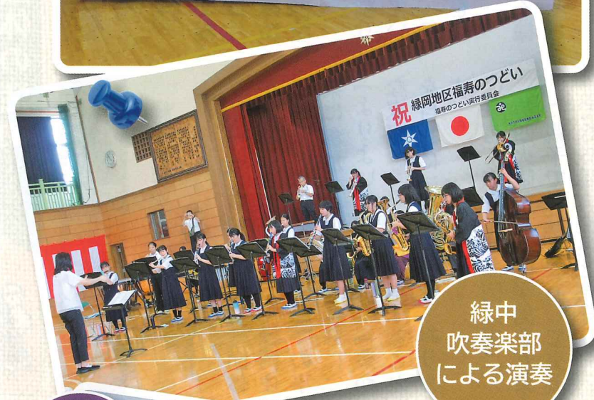
緑中 吹奏楽部 による演奏