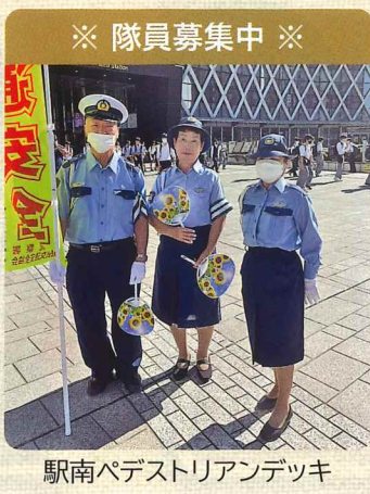
※ 隊員募集中 ※ 駅南パデストリアンデッキ

「もう四時だ、暗くなる前 早めの点灯」 秋の交通安全運動スローガン 今日までの活動は、朝の立哨、小学生の下校時の見守り、黄門まつり・千波湖花火大会・水戸黄門漫遊マラソンの立哨、街頭キャンペーン等です。