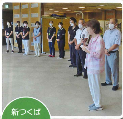
新つくばホームの見学風景