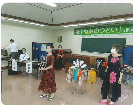
アトラクション (マジックショー)