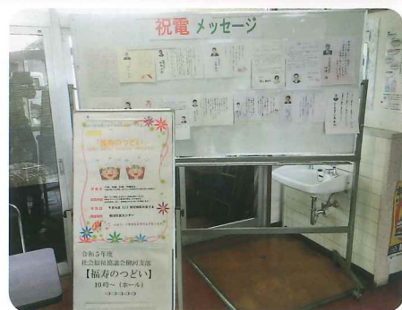
各方面から多数の祝電メッセージ

住民減少や、コロナもありましたが、このようなイベントがあることを、より多くの方に知っていただいで、より多くの地域の方々が参加して頂ければ、地域との交流も活発になり、住みよい街づくりになると思っています。