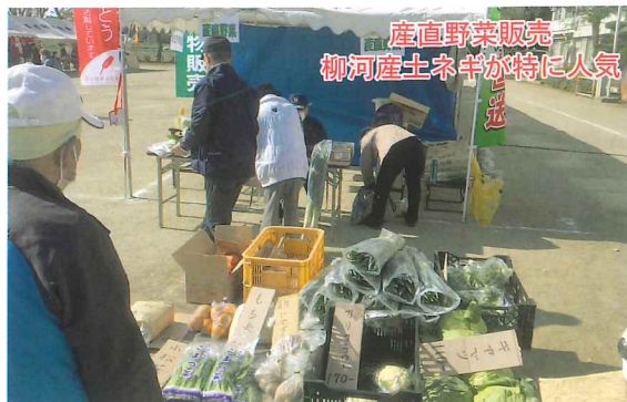
産直野菜販売 柳河産土ネ羊が特に人気