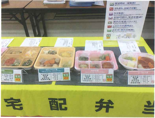
試食お弁当おいしかった

私はこれらの学んだことを今実行に移しております。そして一日でも長く健康寿命を伸ばしたいと思っております。