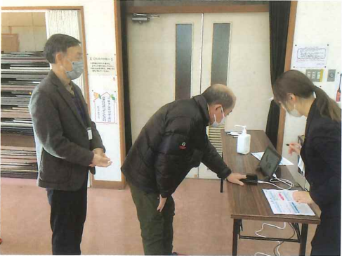
血管年齢を測定中