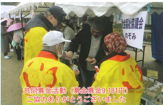
共同募金活動 (募金募金9,181円) 協力ありがとうございました

わたしはお手玉をしましたが、なかなかうまくいきませんでした。地いきの方に教わった通りになおしてみたら、やっとできるようになったのでうれしかったです。楽しそうに遊んでいるみんなを見て、にぎやかな学校行事だなと思いました。