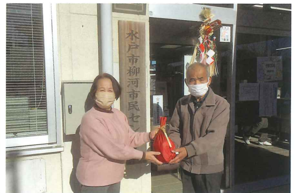
一人暮らしの方へ年末プレゼント風景（69名）