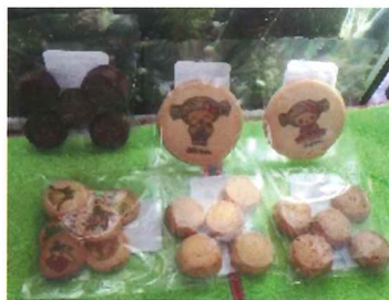
水戸市知的障害者就労支援施設 「みのり」で作られた「みとちゃん」 キャラクター入りのクッキー