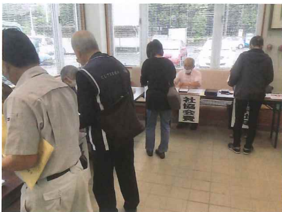
社協会費・日赤募金の受付