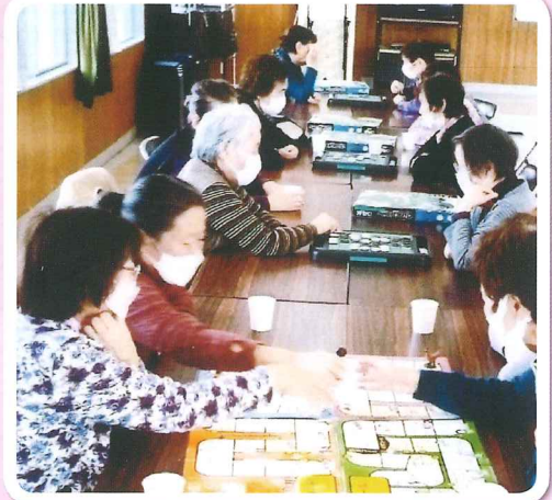
▲ 根強い人気のオセロ