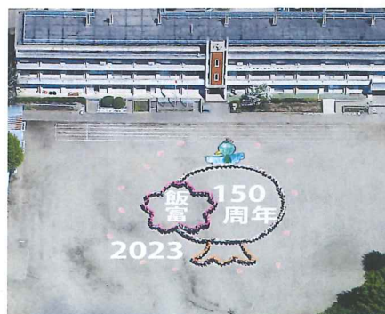
人文字で表した150周年記念マーク