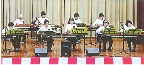
飯富まつり 「にじ」をはじめ5曲披露

大正琴は大正元年、日本人が開発した楽器で、鍵盤を左手で押さえ、右手のピックで弾いて演奏します。姿勢や指使い、楽譜の読み方など基礎から指導していただき、季節に合わせた選曲を3〜4曲ずつ練習します。飯富まつりには、アンサンブルでの発表もしています。 講師の先生から、曲の背景の話なども伺いつつ、重なり合う音色に大正ロマンを感じてみませんか。