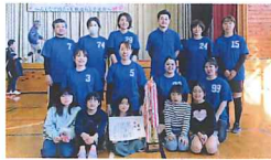
ミックスバレー大会