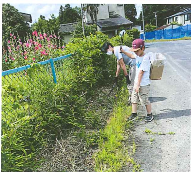
手作りのごみ箱で空き缶拾いをする親子

飯富地区の町内会の皆様、並びに各関係団体の皆様には、部活動にご理解とご協力を賜り厚くお礼申し上げます。今年度も美しい環境づくりの一環として、飯富地区一斉クリーンアップ作戦を開催しました。各町内会の皆様の積極的な活動によりまして、綺麗な生活道路を確保することが出来ました。また集積所においては、産業廃棄物・家電製品・古タイヤ等以外の可燃ごみや空き缶ごみの分別も出来ました。ご協力ありがとうございました。ごさいました。