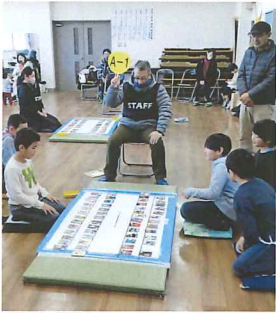
飯富地区かるた大会 (飯富市民センターにて)