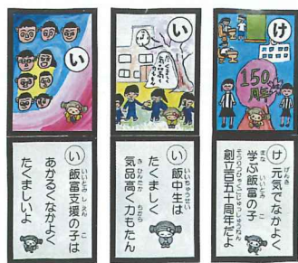
特別支援 飯富中 飯富小 3校の校訓を読んだ絵札・読み札

かるた作りを通して、子供たちは飯富のよさや調べることの楽しさ、みんなで協力することの大切さを感じたようでした。子供たちは将来飯富をさらによい地域にしてくれるのではないかと強く感じました。