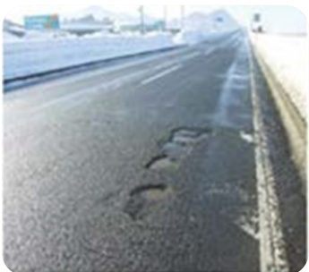
路面の穴ぼこ・ 段差