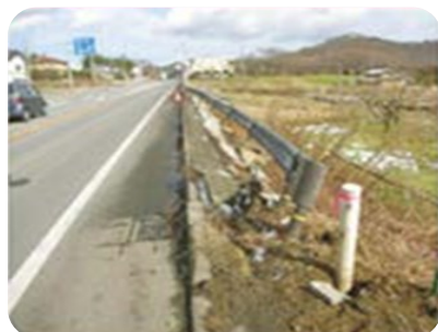
ガードレール・ 標識等の損傷