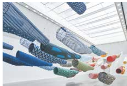
展示風景

日時/6月1日(土)、14:00開演 6月2日(日)、14:00開演 場所/ACM劇場 原作/イブセン 翻訳/大川珠季 演出/深作健太 出演/夏川椎菜、川久保拓司、高山のえみ、 塩谷亮、荻沼栄音、寺戸花、宮地大介 料金/全席指定:S席6,500円、A席5,500円 ※4月6日(土)、チケット一般発売開始。 チケット取扱い/☎225-3555