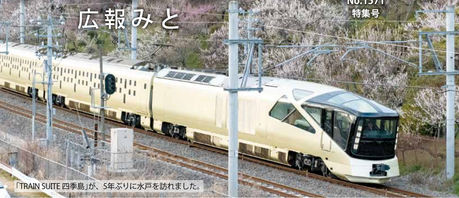
「TRAIN SUITE 四季島」が、5年ぶりに水戸を訪れました。