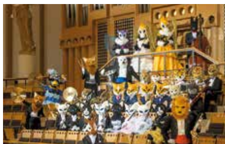
ズーラシアンウインドオーケストラ