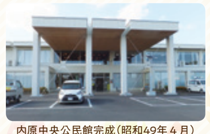
内原中央公民館完成(昭和49年4月) (現内原市民センター)