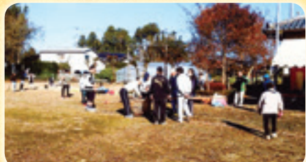
三世交流事業(赤尾関)