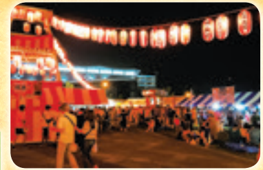
内原商工会夏祭り