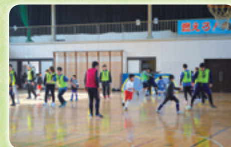
市民スポーツ大会