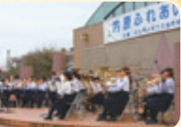
内原小金管バンド