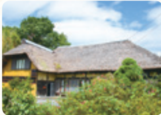
江戸時代後期の森田家住宅