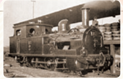
明治時代の蒸気機関車