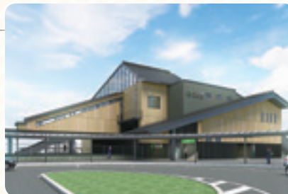
内原橋上駅舎完成予想図