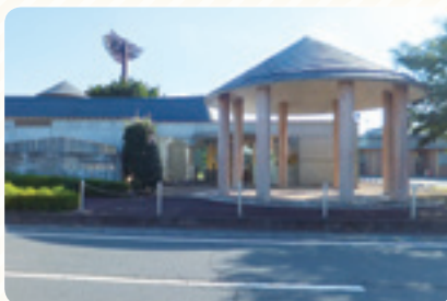
郷土史義勇軍資料館完成(平成15年2月)