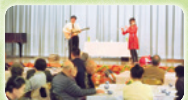
一人暮らしクリスマス会