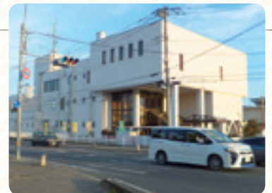
水戸市役所内原出張所