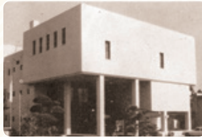
内原町役場新庁舎竣工(昭和54年)