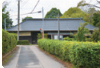
江戸時代の飯田家長屋門