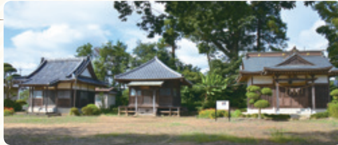
満徳寺、薬師寺、春日神社