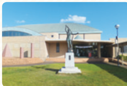
内原町ヘルスパーク完成(平成5年11月)