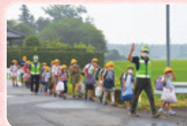
登下校安全見守り