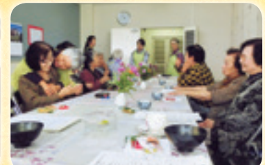
おしゃべりサロン