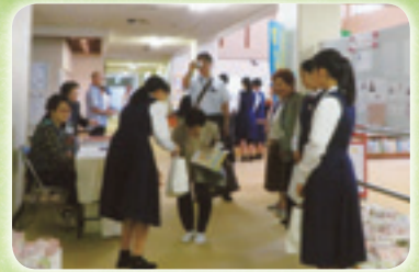
内原中学校ボランティア(敬老会)