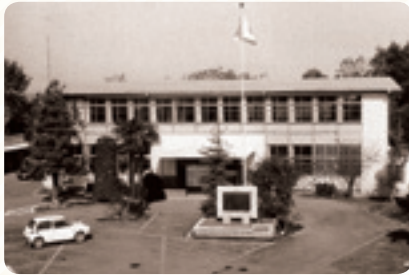
内原村役場庁舎竣工(昭和34年)