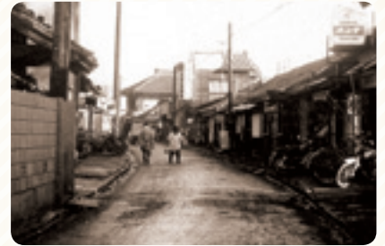
昭和30年代の駅前通りと商店街