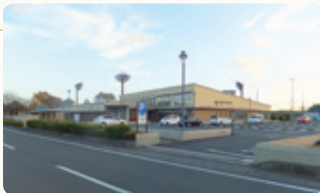
内原図書館完成(平成22年4月)