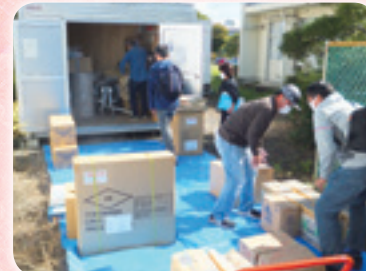
防災倉庫備蓄品点検