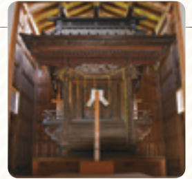
春日神社本殿(1570年) 水戸の指定文化財