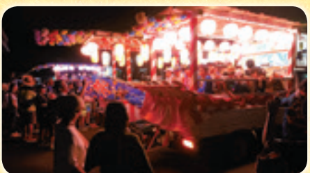
内原子供みこし夏祭り